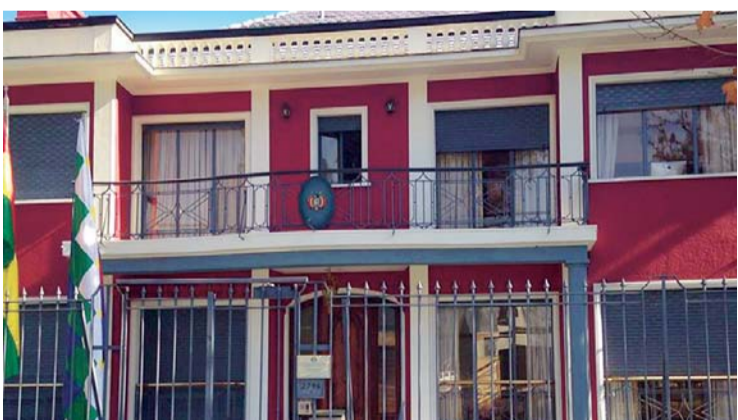
EDIFICIO DONDE FUNCIONA EL CONSULADO BOLIVIANO EN CHILE.

Mediante un comunicado oficial, emitido por el Ministerio de Relaciones Exteriores de Bolivia, se informó que el hecho fue conocido cerca de las 00.20 de ayer, cuando el consulado boliviano recibió la amenaza de la presencia de tres artefactos explosivos en sus oficinas.