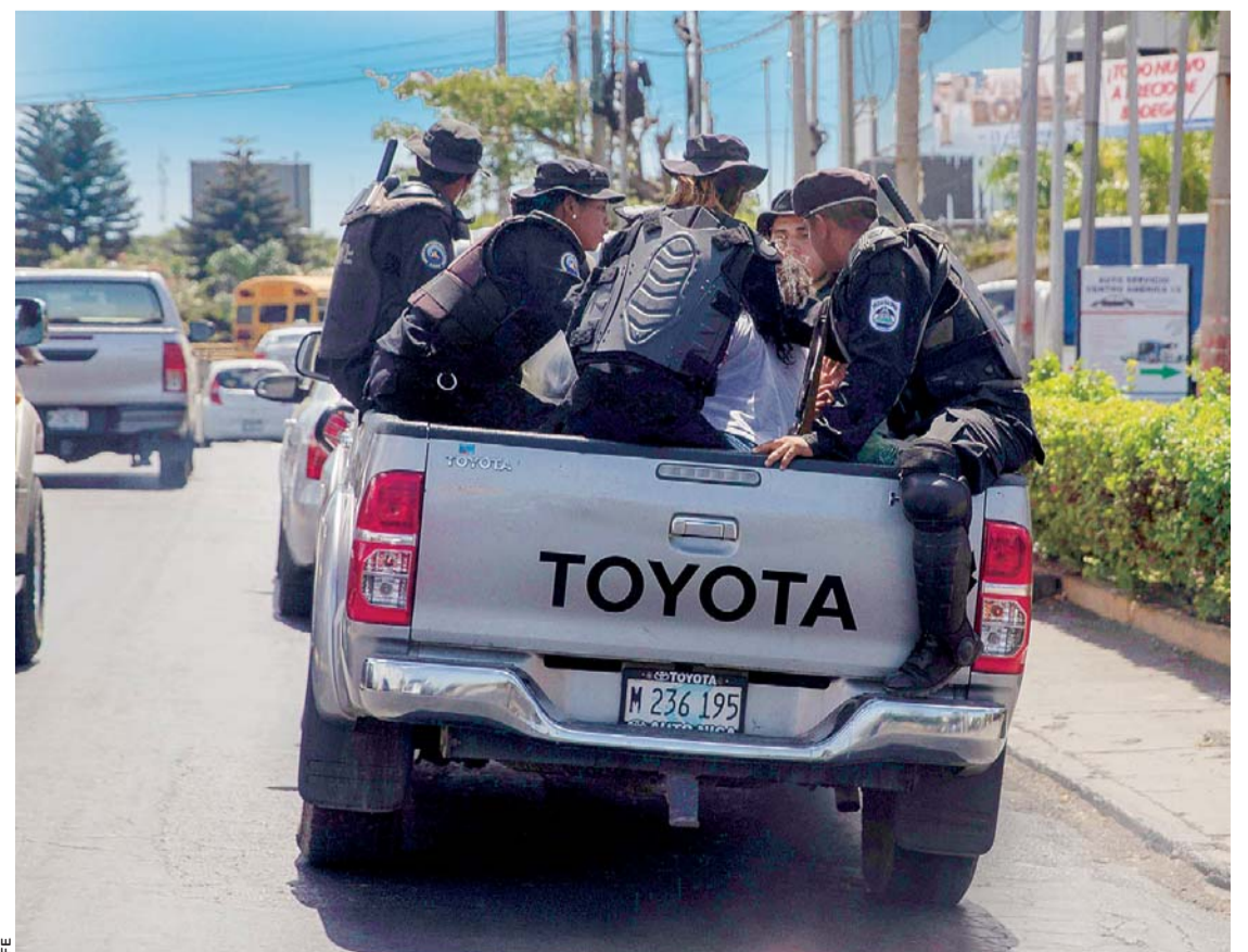
MIEMBROS DE LA POLICÍA NACIONAL DETIENEN A VARIOS MANIFESTANTES. FUE EL SÁBADO PASADO, EN MANAGUA (NICARAGUA).

El listado de manifestantes presos es preliminar, ya que el Gobierno no ha dejado de capturar civiles, pese a que existen negociaciones entre los representantes del Estado y la oposición para superar la grave crisis sociopolítica que atraviesa Nicaragua, indicó el Comité.