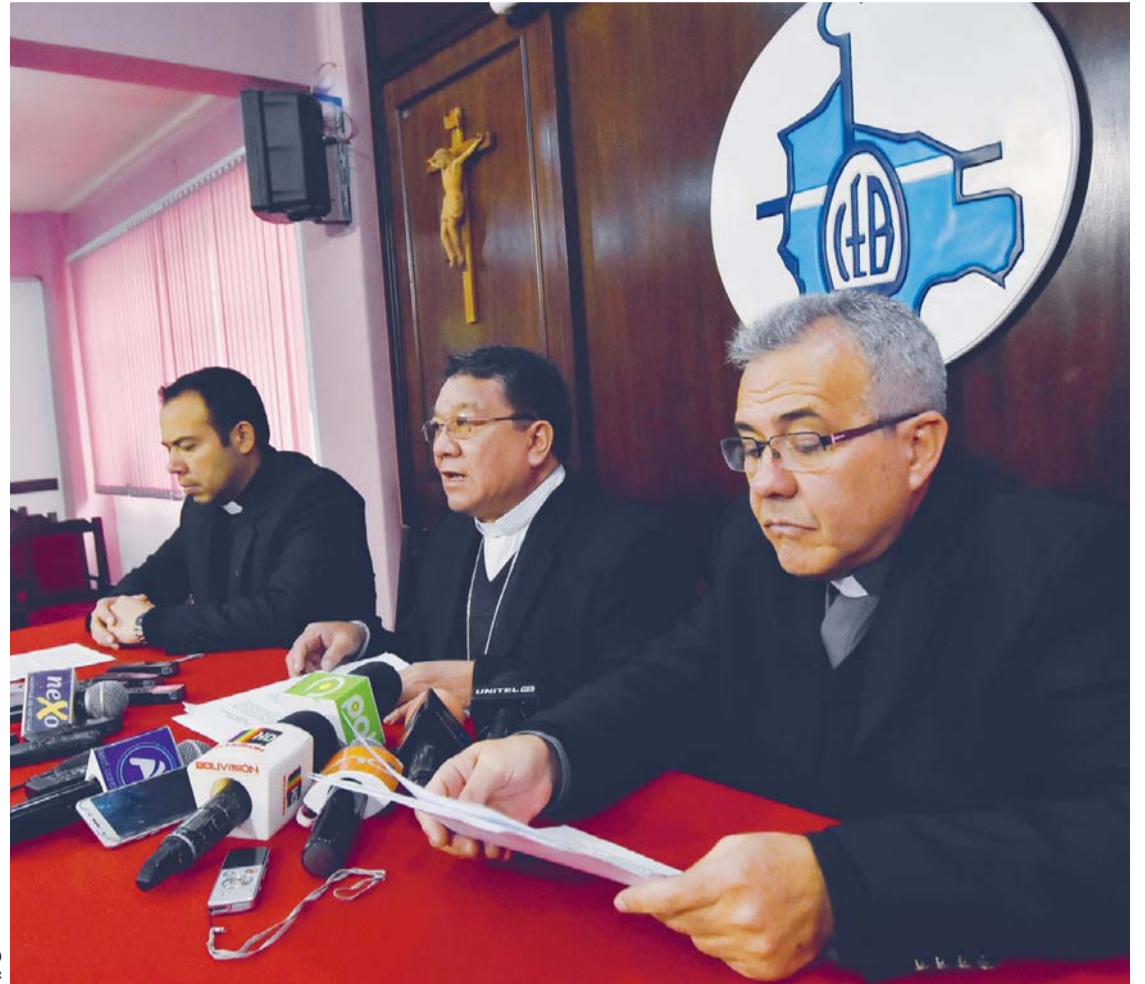
CONFERENCIA DE PRENSA DE LAS AUTORIDADES DEL CLERO BOLIVIANO.