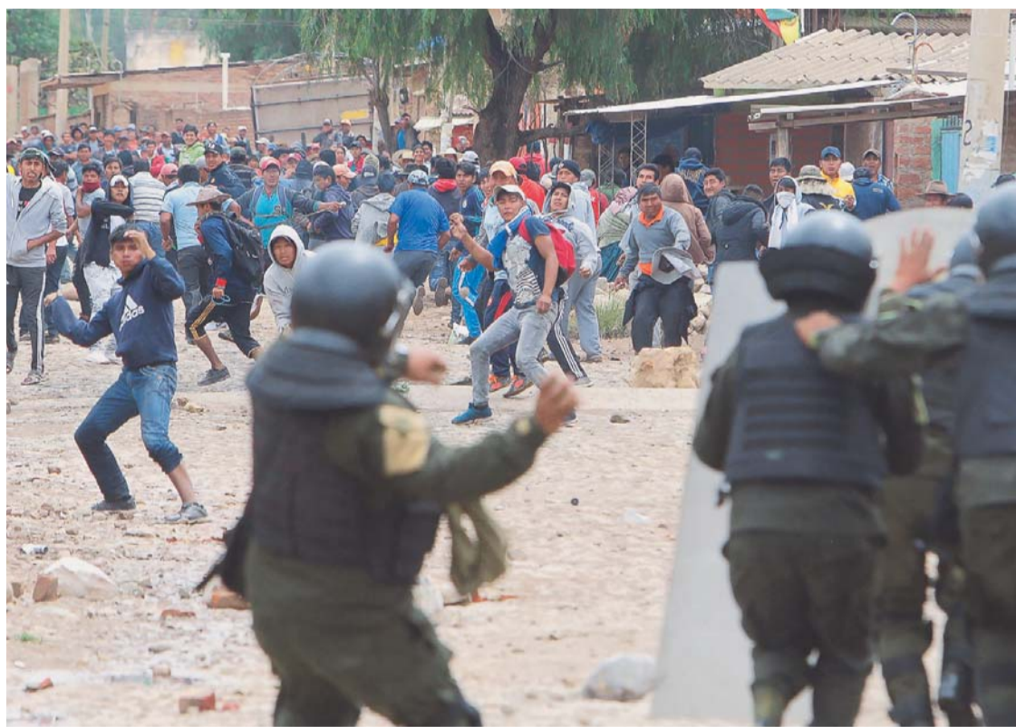
ACCIÓN POLICIAL Y ENFRENTAMIENTO CON COMUNARIOS DE SIPE SIPE. FUE AYER EN COCHABAMBA.

> Enfrentamientos continuaron, pese a que vía que estaba bloqueada fue despejada