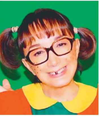
"LA CHILINDRINA" PERSONAJE MUY QUERIDO POR LOS NIÑOS DE AYER Y DE HOY ESTÁ EN BOLIVIA.

Para alegría de los niños, la popular actriz mexicana María Antonieta de las Nieves, quien encarna a "La Chilindrina" de la famosa serie "El Chavo del 8" que se difunde en televisoras de Latinoamérica por más de cuatro décadas, ayer llegó a te-