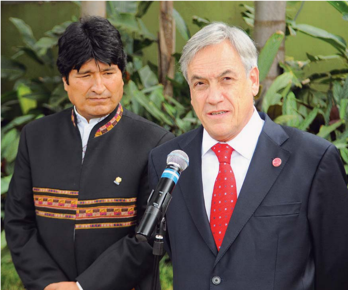
PRESIDENTES DE BOLIVIA Y CHILE DURANTE UNA REUNIÓN INTERNACIONAL EFECTUADA EL PASADO AÑO.

tenga como objetivo el restablecimiento de las relaciones diplomáticas con el Estado Plurinacional de Bolivia, comenzando dicho proceso con el restablecimiento de nuestra embajada en dicho país", sostiene el documento.