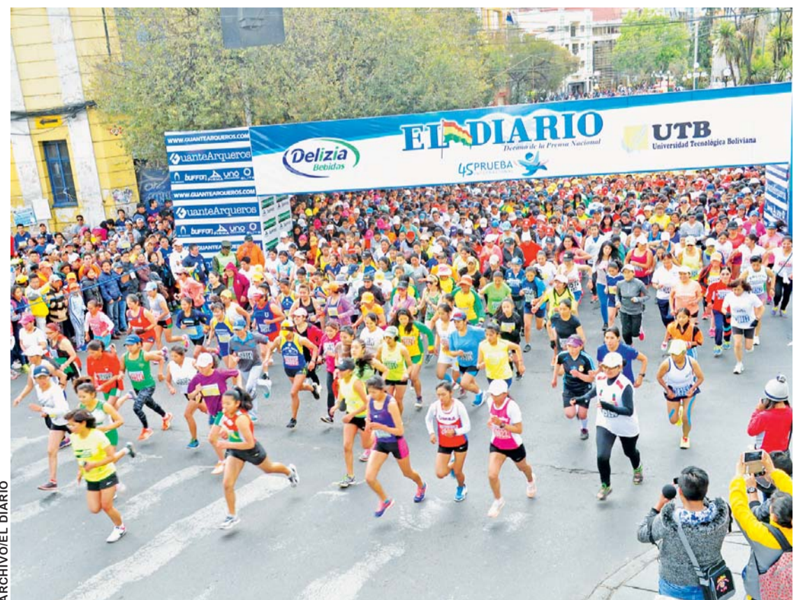
MOMENTO DE LA PARTIDA EN LA CATEGORÍA DAMAS FUE EL AÑO PASADO EN LA TRADICIONAL PRUEBA.