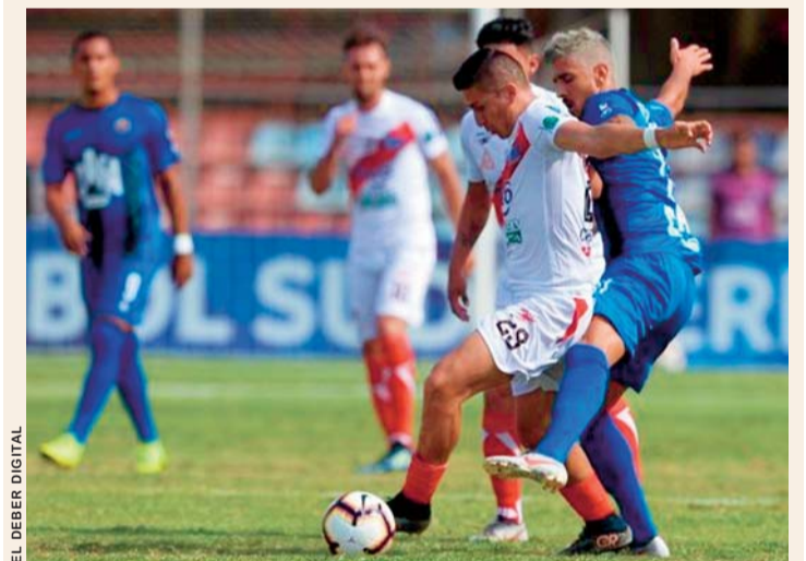
ACCIÓN DEL PARTIDO EN VENEZUELA.

nales; instancia en la que cayó. En los penales, los potosinos se aplazaron al fallar las cuatro ejecuciones, mientras que los venezolanos acertaron en dos. El resultado final fue 2-0, con el que nuestro representativo se despidió de la Copa.