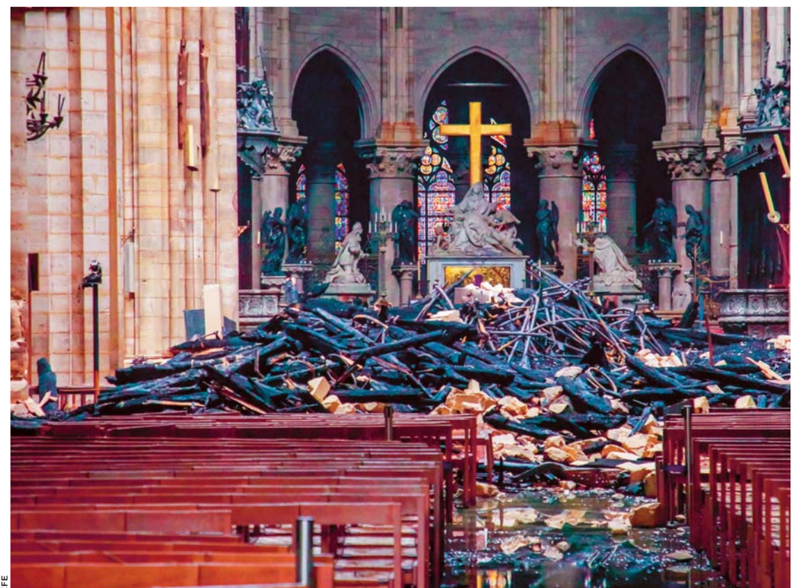
VISTA DEL INTERIOR DE LA CATEDRAL DE NOTRE DAME, UN DÍA DESPUÉS DEL INCENDIO.

De multimillonarios donativos se supo, algunos recibieron la noticia con beneplácito, otros criticaron.