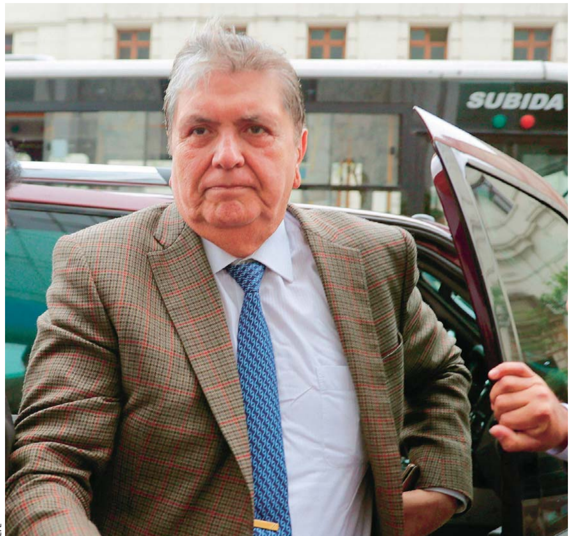
IMAGEN DE ARCHIVO, FECHADA EN LIMA EL 15 DE NOVIEMBRE DE 2018.

El ministro del Interior, Carlos Morán, afirmó que la diligencia realizada por la Policía Nacional y el Ministerio Público en la vivienda de García se hizo en cumplimiento estricto de una orden judicial de detención preliminar por diez días solicitada por el fiscal José Domingo Pérez.