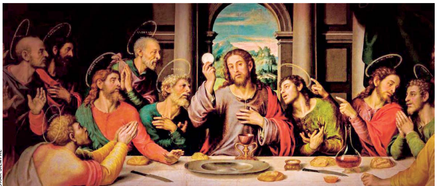
LA ÚLTIMA CENA DE JESÚS CON SUS APÓSTOLES.

La liturgia del Jueves Santo es una invitación a profundizar concretamente en el misterio de la Pasión de Cristo, ya que quien desee seguirle tiene que sentarse a su mesa y, con máximo recogimiento, ser espectador de todo lo que aconteció "en la noche en que iban a entregarlo".