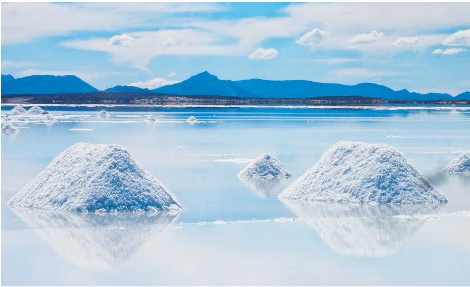
PREOCUPA A LA POBLACIÓN POTOSINA EL DESTINO DE SUS RIQUEZAS.