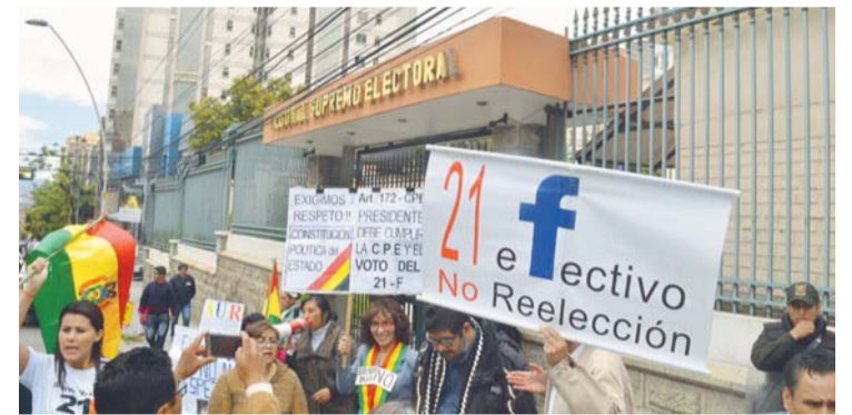
PROTESTA DE PLATAFORMAS CONTRA LABOR DEL TSE.

Entretanto, los organismos observan un panorama internacional adverso, en especial por el enfrentamiento comercial entre Estados Unidos y China; además señalan que los créditos baratos terminaron y que los inversionistas prefieren economías seguras.