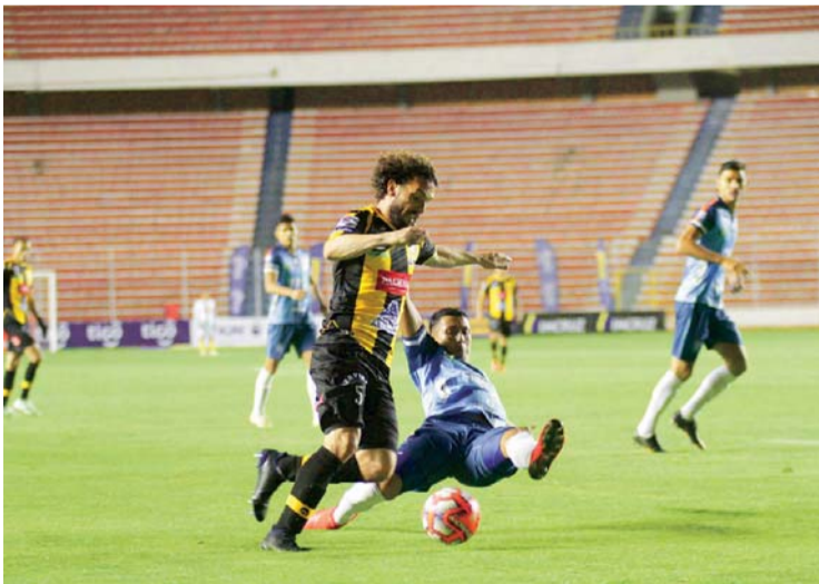
INCIDENCIAS DEL PARTIDO JUGADO ANOCHE EN LA PAZ.