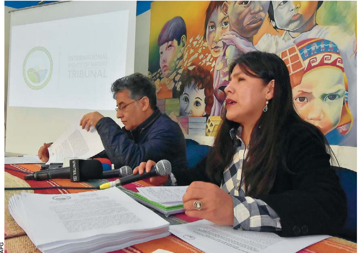
AYER DURANTE LA COMUNICACIÓN DE LA SENTENCIA Y LOS PUNTOS DE SU CONTENIDO.

Unidos) para ingresar a la zona y reunirse con los indígenas y el Gobierno.