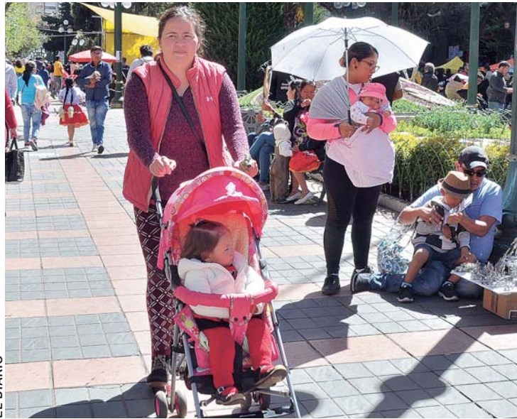
FELICIDADES A TODAS LA MADRES BOLIVIANAS.

A pesar de los tiempos de modernidad, hay motivos que nunca cambian y una de ellas es el amor que se expresa en un día tan especial al ser más querido por todos, como son las madres, valientes mujeres enfrentan todas las adversidades de la vida, trabajando con esfuerzo desde la madrugada hasta altas horas de la noche.