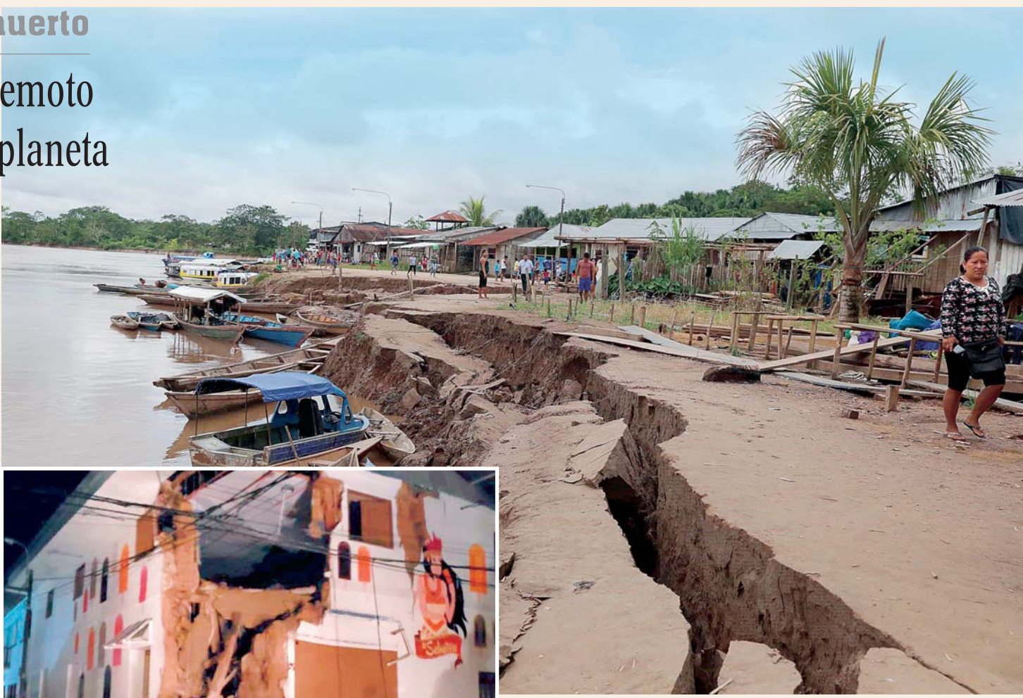
EL TERREMOTO DE GRAN MAGNITUD OCURRIÓ A LAS 2.41 HORAS Y SACUDIÓ GRAN PARTE DE SUDAMÉRICA. EL EPICENTRO SE UBICÓ EN LA AMAZONÍA PERUANA.

La mayoría de los heridos se encuentra en la ciudad amazónica de Yurimaguas, la más cercana al epicentro del terremoto, a donde a primera hora de este domingo llegó el presidente de Perú, Martín Vizcarra, junto a dos ministras para hacer una evaluación de los daños en primera persona.