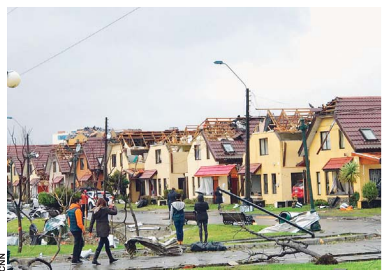
FENÓMENO CLIMÁTICO EN CONCEPCIÓN Y TALCAHUANO QUE DEJÓ IMPORTANTES DAÑOS MATERIALES.

Las turbulencias meteorológicas abarcaron las regiones del Maule, Nuble, Bío Bío y La Araucanía, dijo la Oficina Nacional de Emergencia (Onemi), mientras se esperan nuevas lluvias y vientos de intensidad moderada y tormentas eléctricas en dichos territorios y las autoridades se movilizan para socorrer a los afectados.