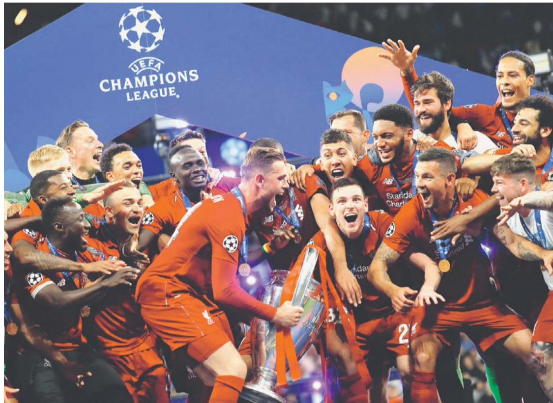
FESTEJO DE LOS CAMPEONES DE LA UEFA CHAMPIONS LEAGUE : LIVERPOOL