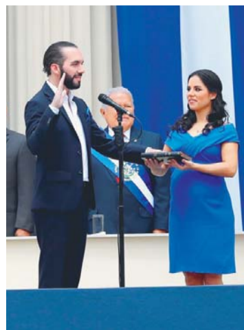
NAYIB BUKELE DURANTE EL JURAMENTO.

Bukele que es un joven empresario, juró el cargo ante el presidente de la Asamblea Legislativa, Norman Quijano, quien posteriormente le impuso la banda presidencial ante cientos de invitados especiales, incluidos siete mandatarios, y ciudadanos.