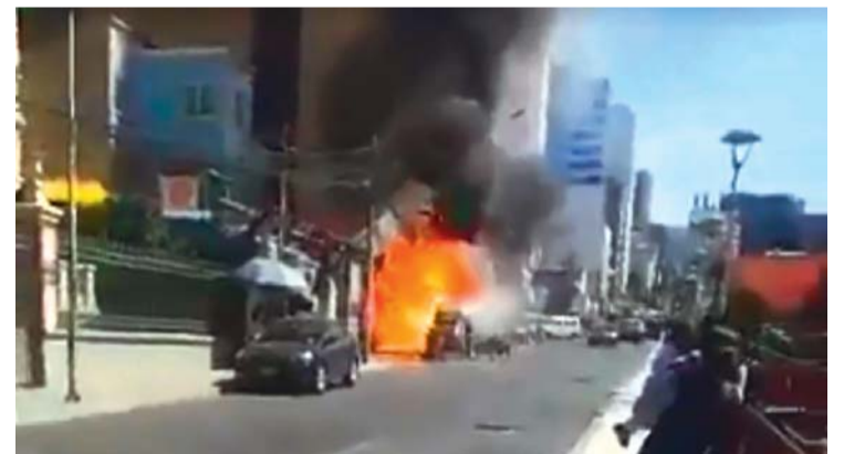
CAPTURA DE PANTALLA MUESTRA EL MOMENTO EN QUE EL FUEGO SE EXTENDÍA EN LA AVENIDA 6 DE AGOSTO.

Bomberos reportó que no se registró heridos, sólo daños materiales, y la zozobra de transeúntes por la magnitud del fuego.