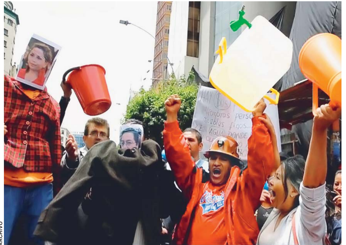
MOVILIZACIÓN EN LA PAZ PIDIENDO JUICIO A LOS RESPONSABLES DE LA CRISIS DEL AGUA EN EL 2016.

El viernes pasado, el Ministerio Público, al no haber objeciones, cerró las investigaciones con una resolución de sobreseimiento, sin hallar a los responsables de la crisis del agua. Esta determinación libera de culpa a cuatro imputados por el denominado caso Epsas.