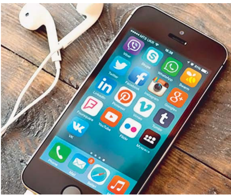
LA IGLESIA CATÓLICA PIDE HACER USO HONESTO PARA TRANSMITIR MENSAJES POR MEDIOS TECNOLÓGICOS DE AMPLIO ALCANCE.