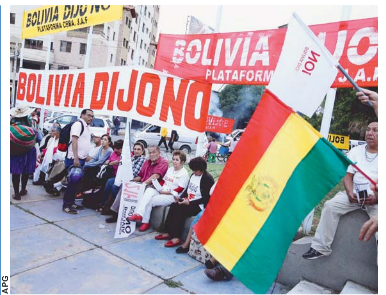
PLATAFORMAS APOYARÁN DEFENSA DEL REFERÉNDUM DEL 21F CON PLANTONES EN CADA DEPARTAMENTO.

El último accidente registrado en la zona de Achumani evidenció la carencia de control, tanto de autoridades de la unidad policial de Tránsito y Tráfico y Vialidad de la Alcaldía de La Paz.