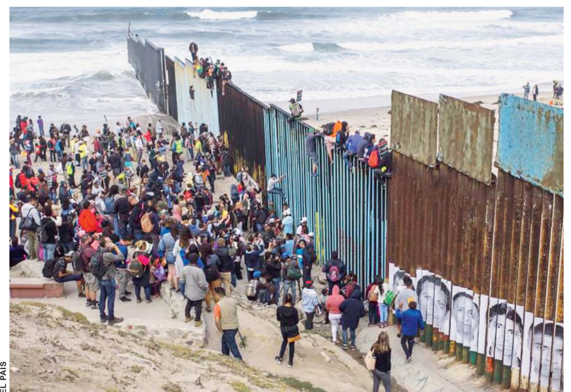
ESTADOS UNIDOS Y MÉXICO ALCANZARON UN ACUERDO CON EL QUE WASHINGTON DEVOLVERÁ A SU VECINO A TODOS LOS INMIGRANTES SOLICITANTES DE ASILO.

Por ello, sostienen que lo sucedido esta semana en Washington "no fue una negociación, fue una rendición".