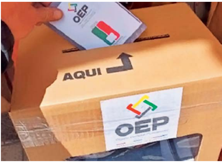
DENUNCIAS ACERCA DEL PADRÓN ELECTORAL PODRÍAN QUITAR CREDIBILIDAD A LAS ELECCIONES DE OCTUBRE.