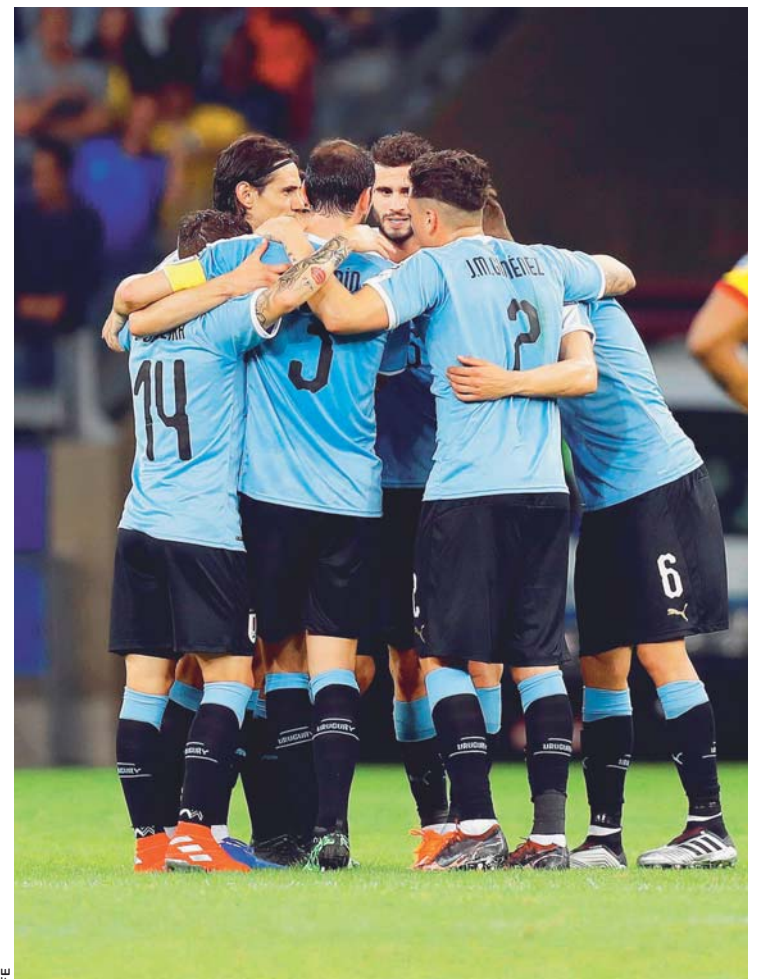
JUGADORES DE URUGUAY CELEBRAN UN GOL DURANTE EL PARTIDO URUGUAY-ECUADOR DEL GRUPO "C" DE LA COPA AMÉRICA DE FÚTBOL 2019, EN EL ESTADIO MINEIRÃO DE BELLO HORIZONTE, BRASIL.