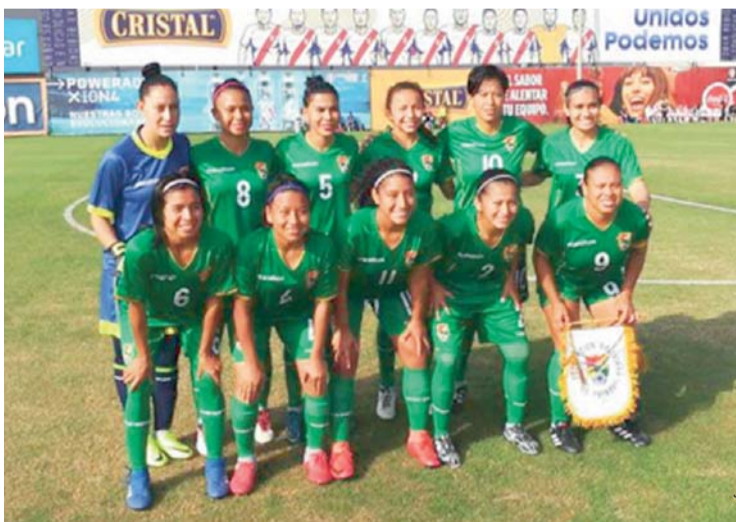
EL DIA DIGITAL