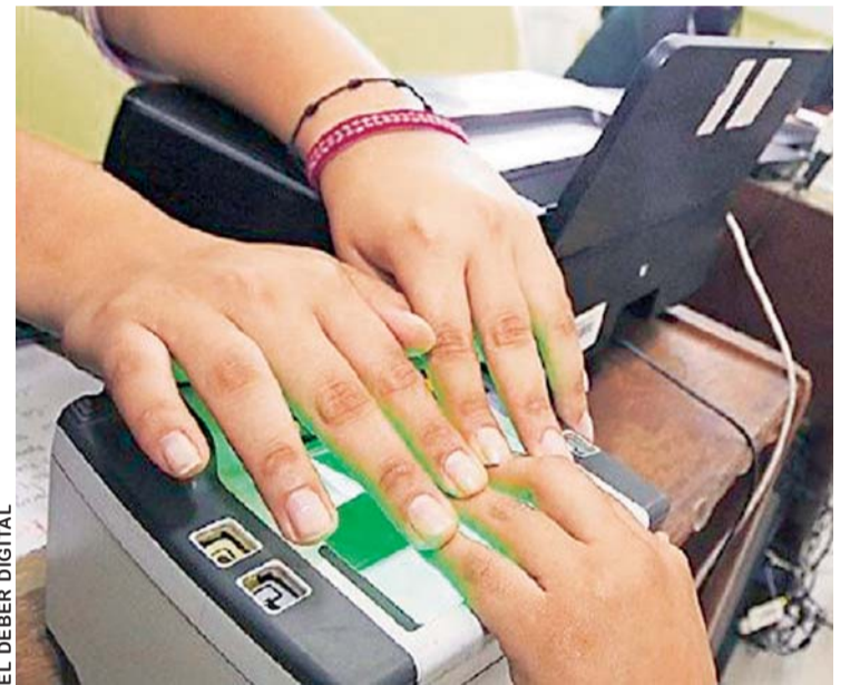
EL DEBER DIGITAL

"La información que tenemos hasta el momento es que la exfuncionaria no se ha presentado a declarar ante el Ministerio Público. No hay avance en las investigaciones y los fiscales se han cerrado para darnos información sobre este caso, presumimos que las autoridades judiciales están encubriendo a la funcionaria porque hay otras personas que están detrás de sus acciones", aseguró el dirigente.