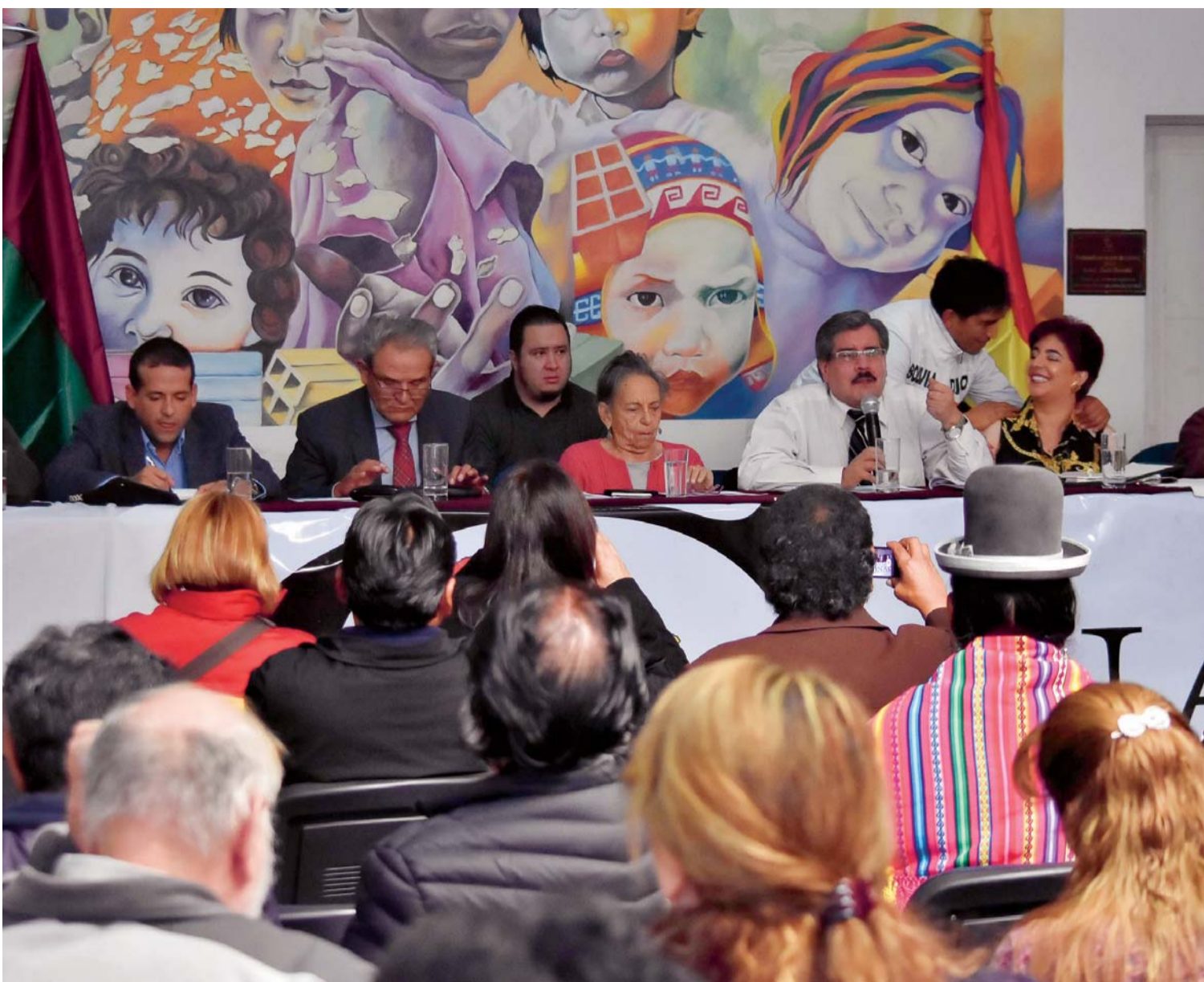
REUNIÓN DE LOS ACTIVISTAS, CÍVICOS Y POLÍTICOS EN DEFENSA DEL 21F; EFECTUADA AYER EN LA PAZ.