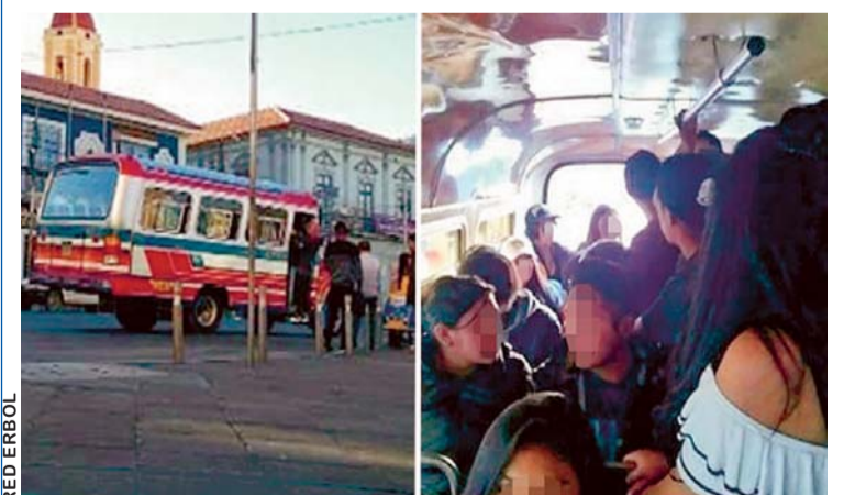
UNA NUEVA ACTIVIDAD ILÍCITA QUE INVOLUCRA A MENORES DE EDAD FUE DESCUBIERTA POR LA POLICÍA.