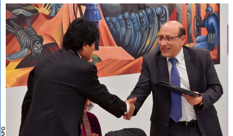
EL PRESIDENTE DEL ESTADO, EVO MORALES, ENTREGA LA LEY 1197 AL PRESIDENTE DE LA ANP-DIARIOS, MARCO ANTONIO DIPP.

La nueva ley también elimina la obligación de prestar un servicio gratuito en la difusión de avisos políticos en tiempos electorales, contemplado en el artículo 74 de la Ley de Organizaciones Políticas, una medida que según la ANP-Diarios caía en la inconstitucionalidad.