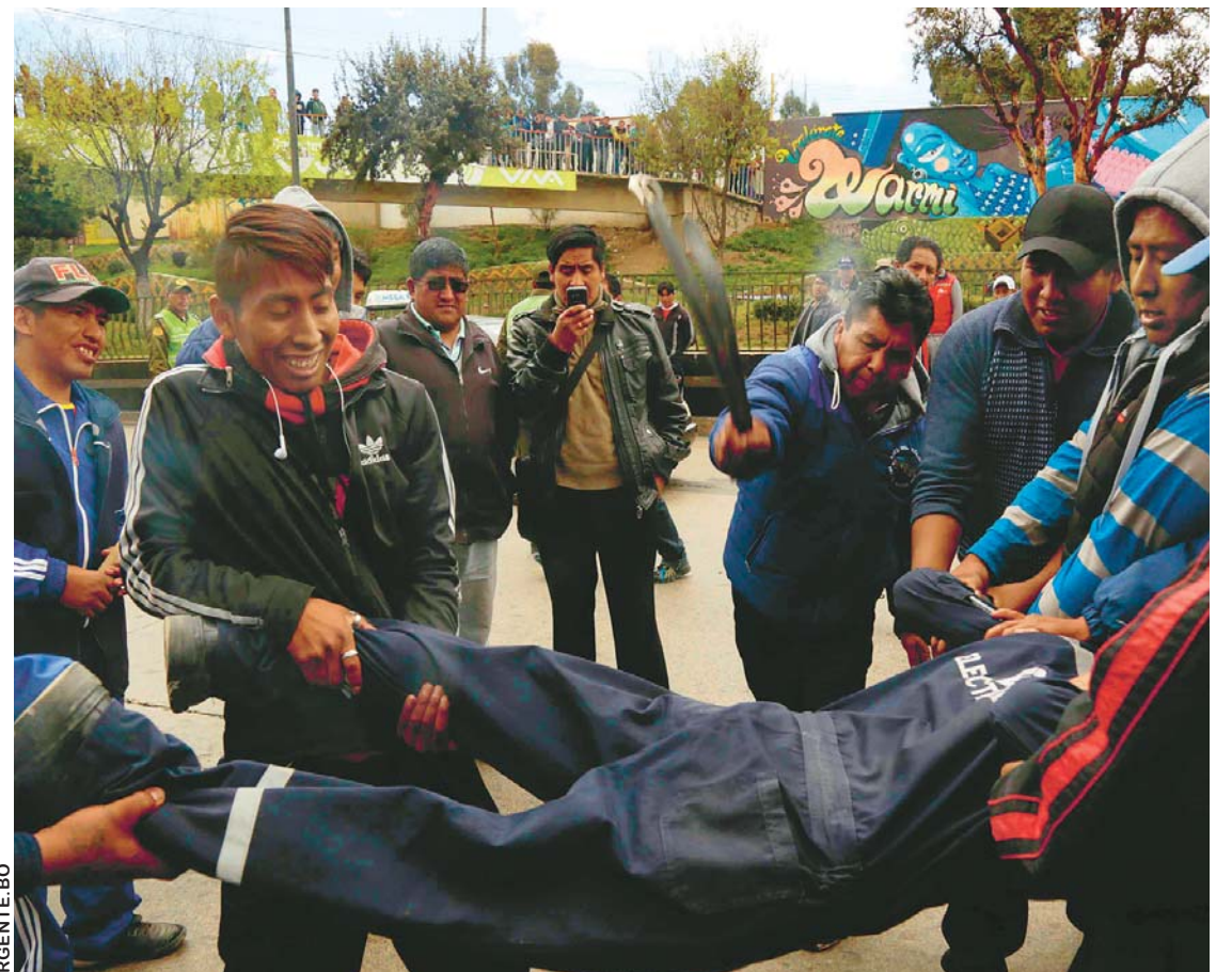
IMAGEN DE ARCHIVO CORRESPONDE A UNO DE LOS DESMANES QUE COMETEN LOS CHOFERES SINDICALIZADOS CUANDO DECIDEN PROTESTAR.

Señaló que el sector del transporte público es egoísta con su reclamo, ya que pese a no haber cumplido con sus promesas de mejorar su servicio ahora buscan impedir el fortalecimiento del transporte municipal.