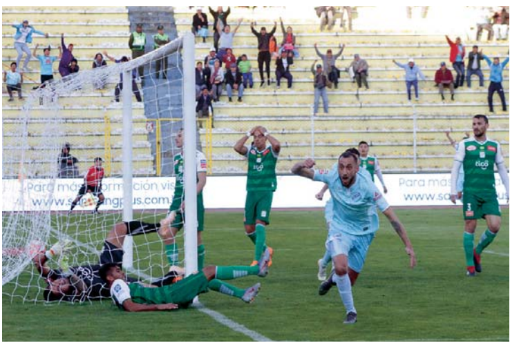
VALERIO DEL DIARIO