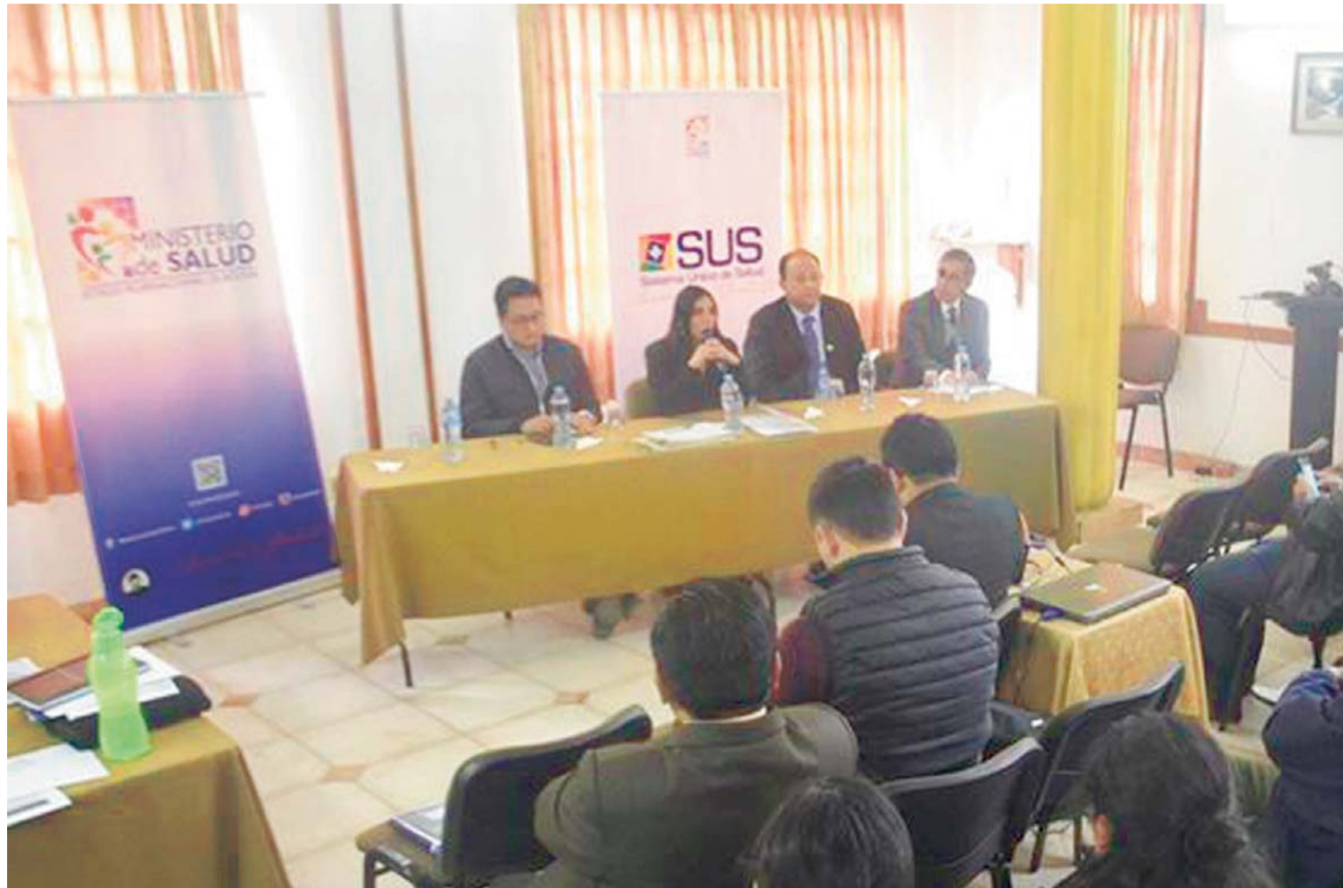
NO PUDO CONCRETARSE EL ACUERDO ENTRE GOBIERNO Y MÉDICOS.

> Rechazaron la presencia de representantes de la COB en la reunión