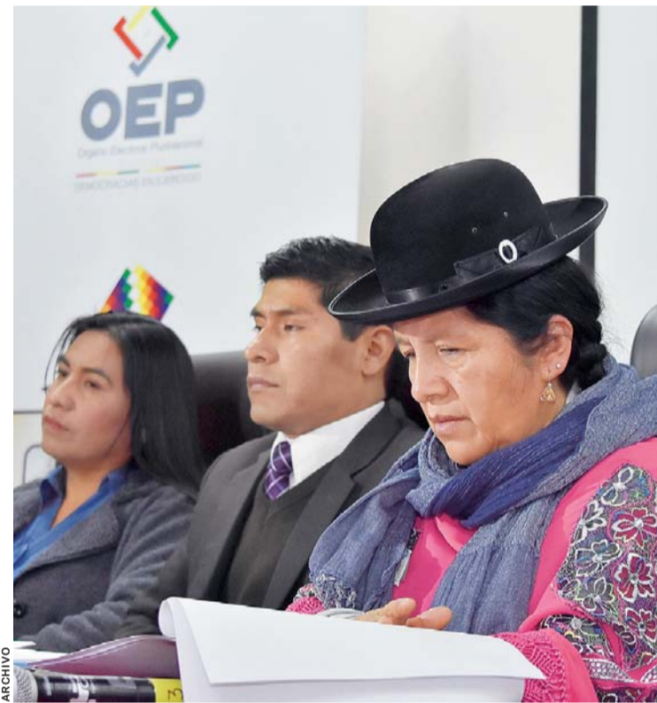
VOCALES DEL TSE.