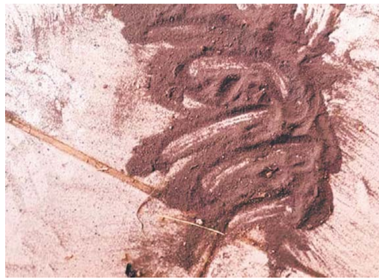
LOS POBLADORES DE LA PROVINCIA JOSÉ MANUEL PANDO SIENTEN LOS EFECTOS DEL VOLCÁN UBINAS DE PERÚ, TRAS LA CAÍDA DE LAS CENIZAS, POR LO QUE PIDEN LA AYUDA DE LAS AUTORIDADES.