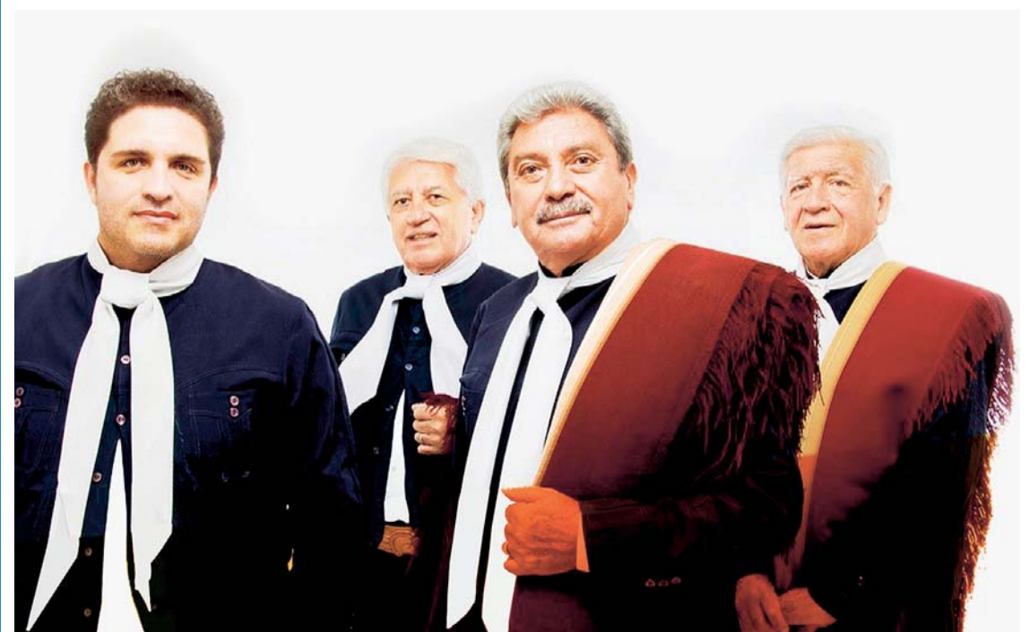
LOS 4 DE CÓRDOBA, MÁXIMOS EXPONENTES DEL FOLKLORE ARGENTINO.

Europa, el viernes 16 de agosto a partir de las 21.30 horas, anunció Víctor Hugo Godoy en visita realizada a EL DIARIO.