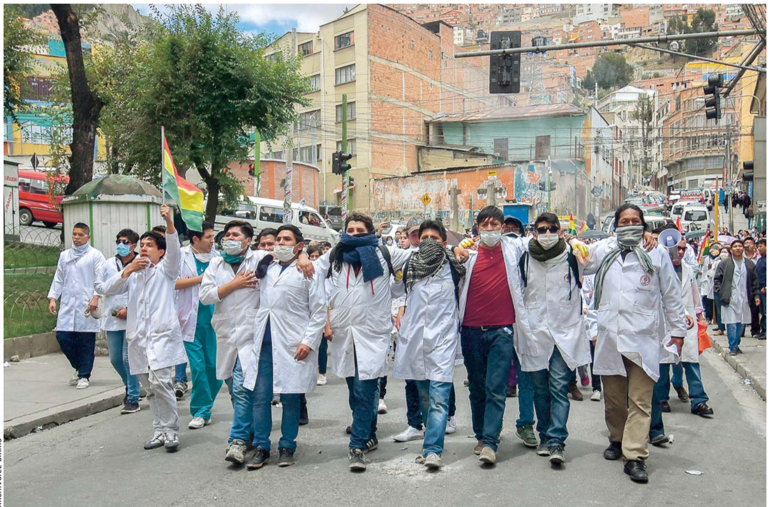
A FINES DEL AÑO 2017, LOS MÉDICOS EFECTUARON FÉRREA MOVILIZACIÓN EN TODO EL PAÍS.

> El sector observa que en los últimos 13 años el Gobierno no haya mejorado el sistema de salud en Bolivia, además censuran la creación del SUS con muchas limitaciones