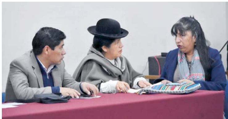
VOCALES DEL TSE.

"Saludamos la firma del convenio intergubernativo entre la Gobernación de Santa Cruz y el Ministerio de Salud para la aplicación del #SUS en ese departamento. Como Estado tenemos la obligación de garantizar el acceso a los servicios de salud de manera pronta y eficiente", escribió en su cuenta en Twitter.