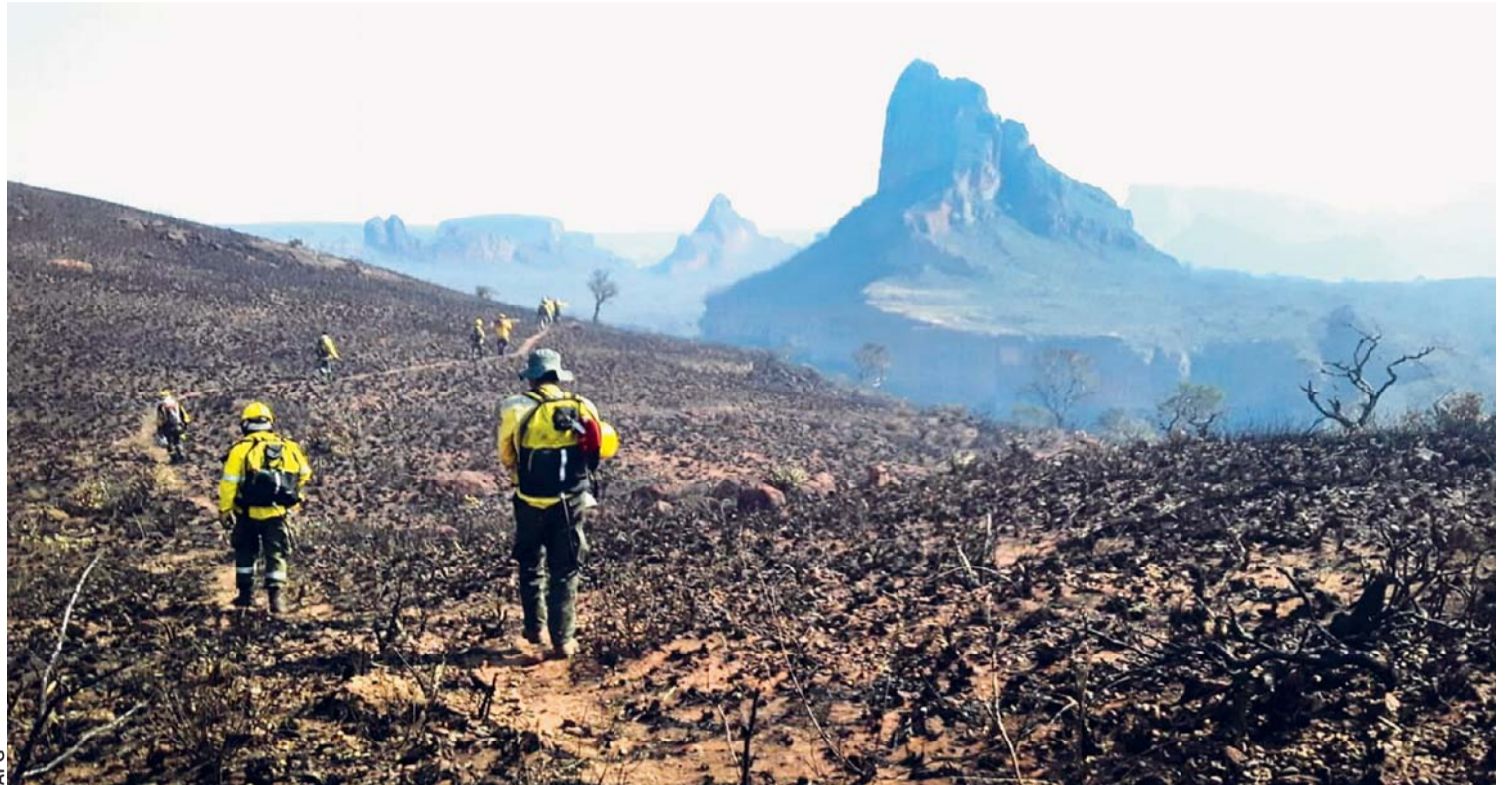
CHIQUITANIA DESPUÉS DEL DESASTRE.