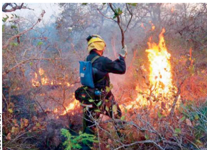
VOLUNTARIO TRATA DE SOFOCAR EL INCENDIO, CON EQUIPO E UNIFORME MUY PRECARIO. (ROBORÉ)

"Aceptar la ayuda internacional es una cosa y otra muy diferente es cumplir con protocolos internacionales para declarar desastre nacional", dijeron.