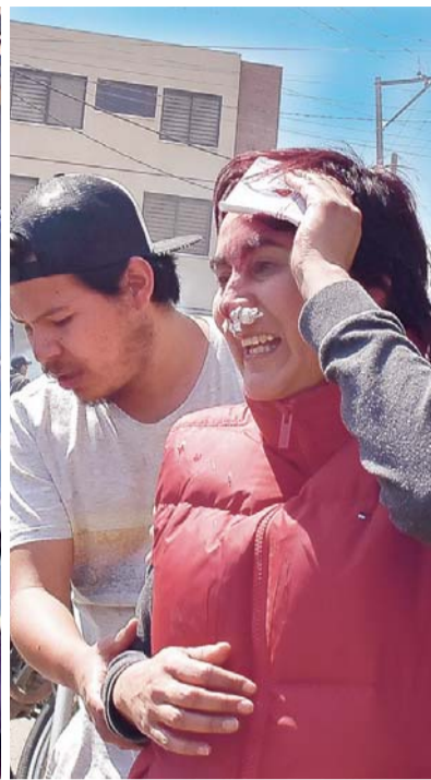
IMÁGENES MUESTRAN EL GRADO DE VIOLENCIA EJERCIDO EN LA ZONA SUR POR DELINCUENTES EBRIOS, QUE DIJERON SER CHOFERES SINDICALIZADOS.