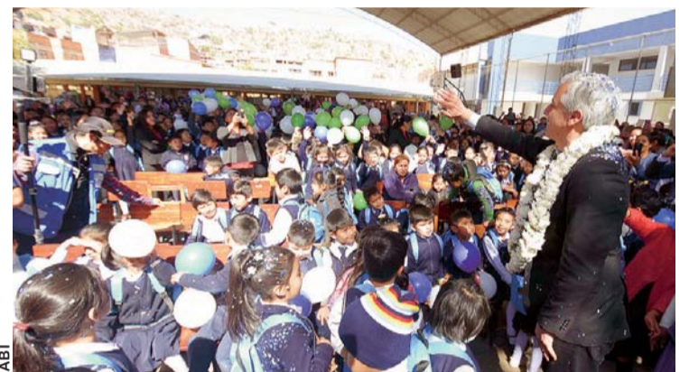
EL VICEPRESIDENTE DEL ESTADO Y CANDIDATO POR EL MAS, ÁLVARO GARCÍA, HACIENDO CAMPAÑA POLÍTICA, FUE FOTOGRAFIADO JUNTO A ESCOLARES.

El pasado domingo, el presidente Evo Morales comunicó que decidió suspender la campaña electoral (del MAS) por al menos una semana, ante el incendio que se registra en la Chiquitania del departamento de Santa Cruz.