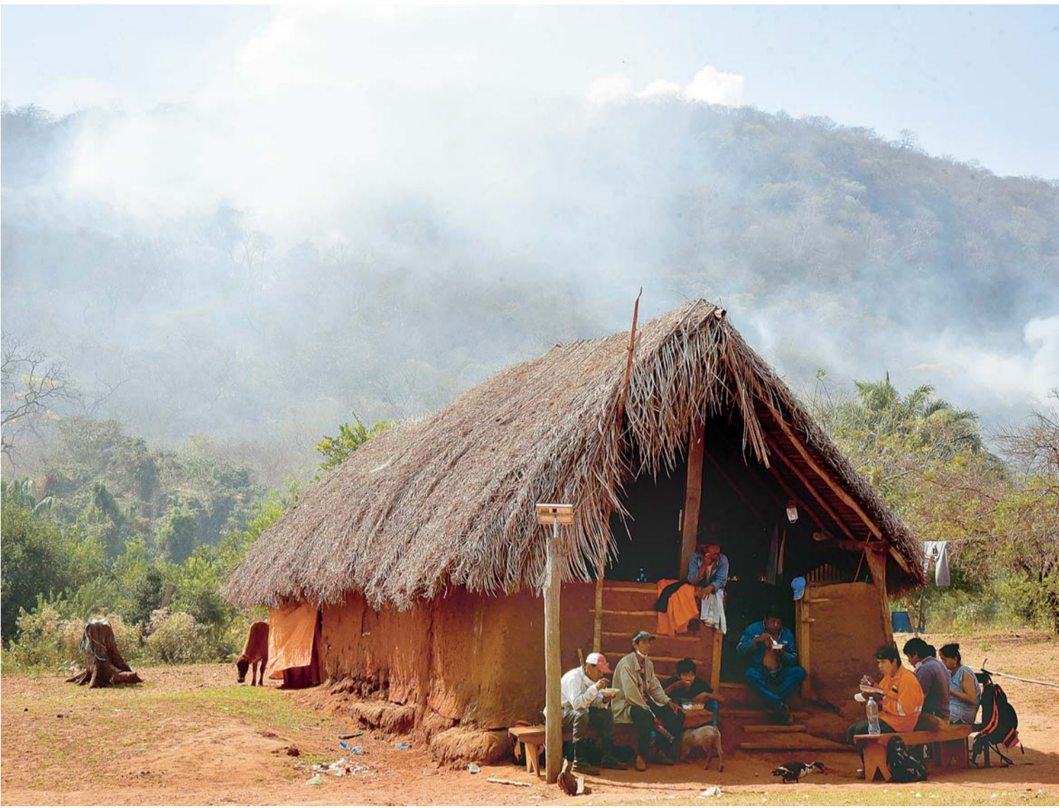
BOMBEROS TOMAN UN RESPIRO DESPUÉS DEL ARDUO TRABAJO PARA SOFOCAR EL INCENDIO EN CHIQUITANIA Y EL FUEGO CONTINÚA VORAZ. FUE AYER.