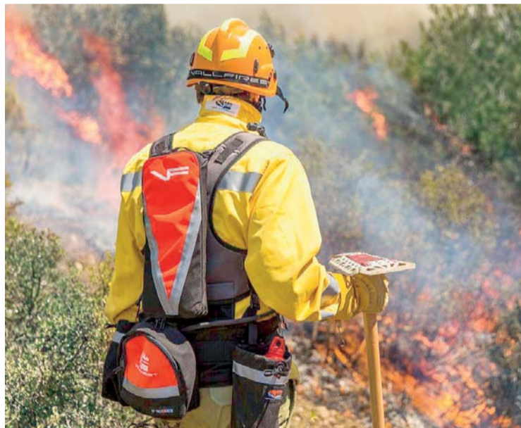
EL FUEGO EN LA CHIQUITANIA CONTINÚA SIN CESAR Y AVANZA PELIGROSAMENTE A OTRAS REGIONES.

Asimismo, se convocó a un cabildo nacional para el 10 de octubre con la finalidad de ratificar la