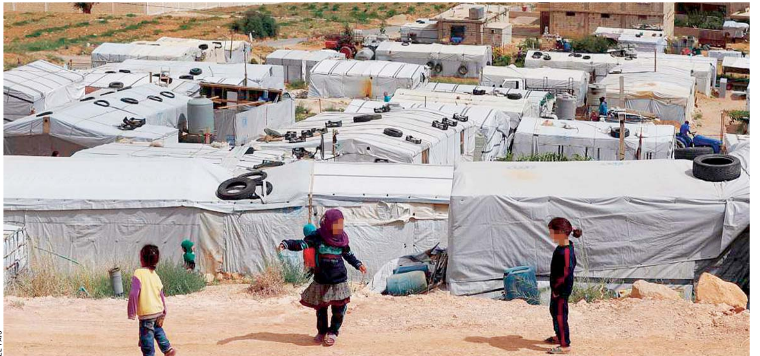
COMPARANDO LOS DATOS DE OTROS AÑOS, SE PUEDE ADVERTIR UNA MAYORÍA DE DESPLAZAMIENTOS EN LA SEGUNDA MITAD DE CADA AÑO, POR LO QUE EL IDMC ESTIMA QUE LOS NUEVOS POR CATÁSTROFES NATURALES SE TRIPLICARÁN PARA FINAL DE 2019, LLEGANDO A LOS 22 MILLONES.

Por otra parte, siete millones de personas en el mundo se encuentran desplazados en sus países debido a desastres naturales. El hecho de que la gran mayoría de ellos se hayan debido a tormentas e inundaciones sugiere, según las predicciones del IDMC, que los desplazamientos masivos a causa de condiciones meteorológicas extremas se están convirtiendo en la norma.