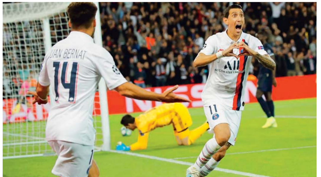
INCIDENCIAS DEL ENCUENTRO ENTRE REAL MADRID Y PARÍS SAINT-GERMAIN.

En París se temía la transformación que sufre el Real Madrid en la Liga de Campeones, que le muta en un equipo temible aunque en el resto de las competiciones no le vayan bien las cosas.