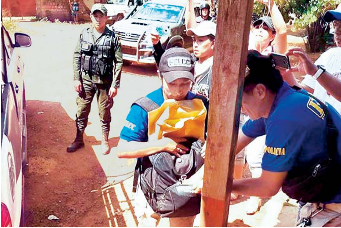
IMAGEN DE ARCHIVO PERTENECE A LA INVESTIGACIÓN QUE HIZO LA POLICÍA RESPECTO A LA DENUNCIA DE ACARRERO DE VOTANTES DE BENI A PANDO EN JUNIO PASADO.