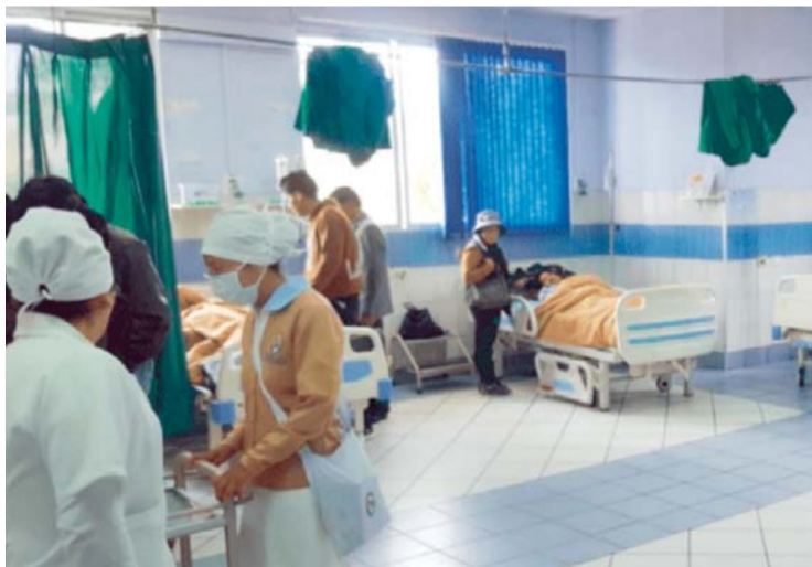
UNIDADES DE EMERGENCIA DE HOSPITALES COLAPSAN DURANTE HUELGAS DE MÉDICOS.