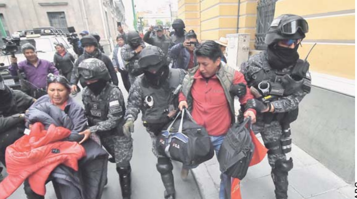
MOMENTO EN QUE LA POLICÍA DESALOJABA A LOS DIRIGENTES DE COMCIPO DE LA PLAZA MURILLO.

De forma violenta, funcionarios de la Policía ayer desalojaron