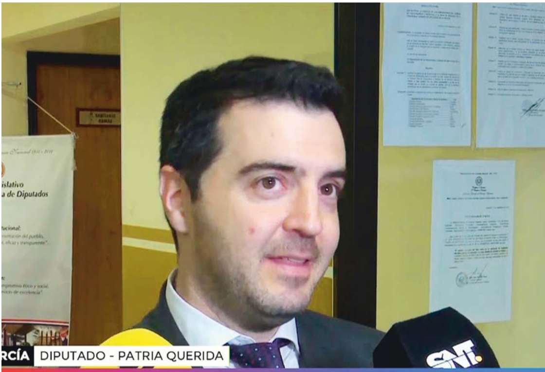
GARCÍA DIPUTADO - PATRIA QUERIDA