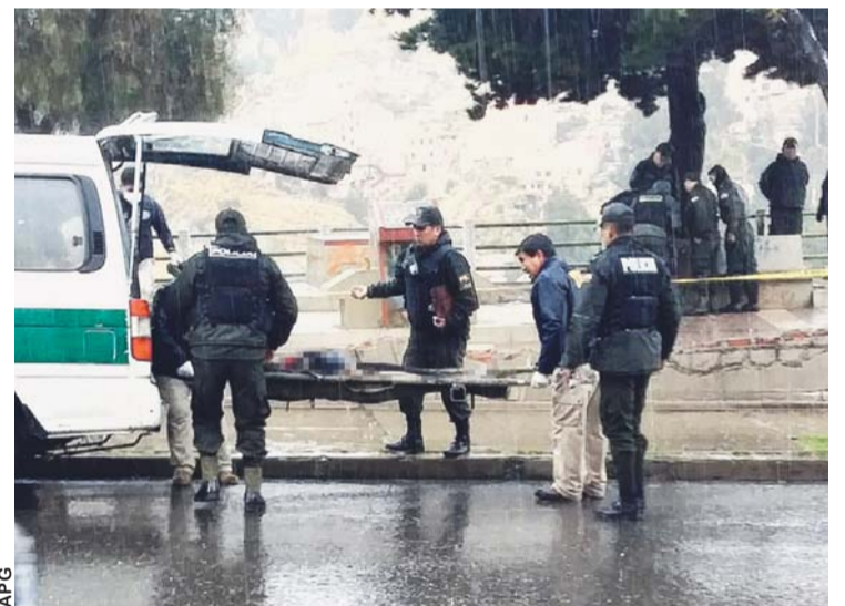
MOMENTO EN QUE LA POLICÍA HACÍA EL LEVANTAMIENTO DE LOS CUERPOS.

> También se registró el desplome de una vivienda en Miraflores