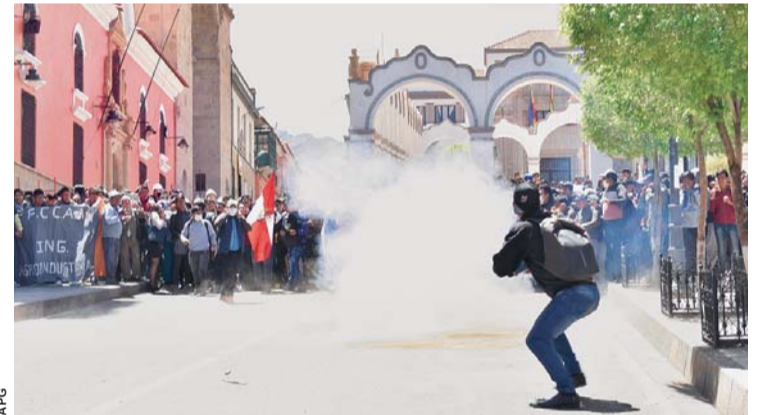
ACCIONES DE PROTESTA DE CIUDADANOS POTOSINOS PARA DEFENDER EL LITIO DE UYUNI.