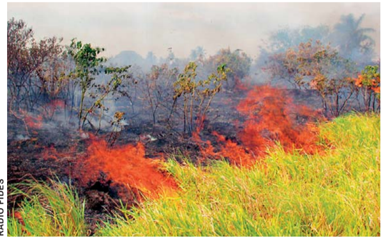
NUEVOS FOCOS DE CALOR EN CONCEPCIÓN.

"En Concepción tenemos la información que se han reactivado tres incendios, esto es justo en los mismos puntos donde estábamos con los incendios importantes. Sería el único municipio donde se habrían reactivado, los otros están en este momento sin incendios", indicó a Fides.