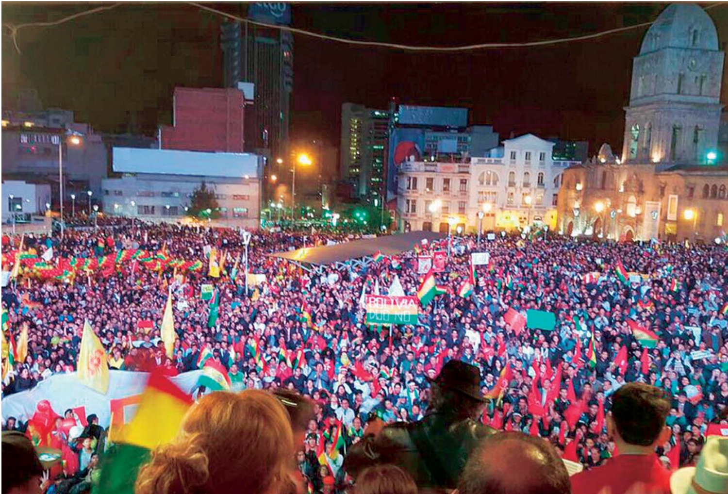
CABILDO EN LA PAZ PIDE RESPETO POR LOS RESULTADOS DEL 21-F. FUE EL AÑO PASADO.