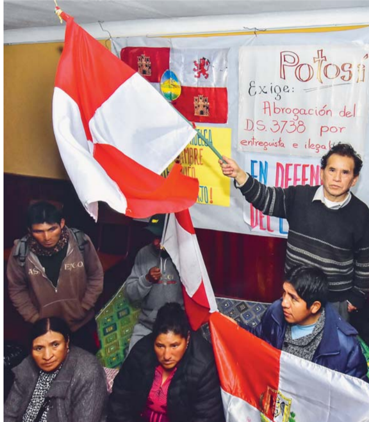
DIRIGENTES DE COMCIPO LEVANTARON EL AYUNO VOLUNTARIO EN LA PAZ PARA INTENSIFICAR LA PROTESTA EN SU DEPARTAMENTO.