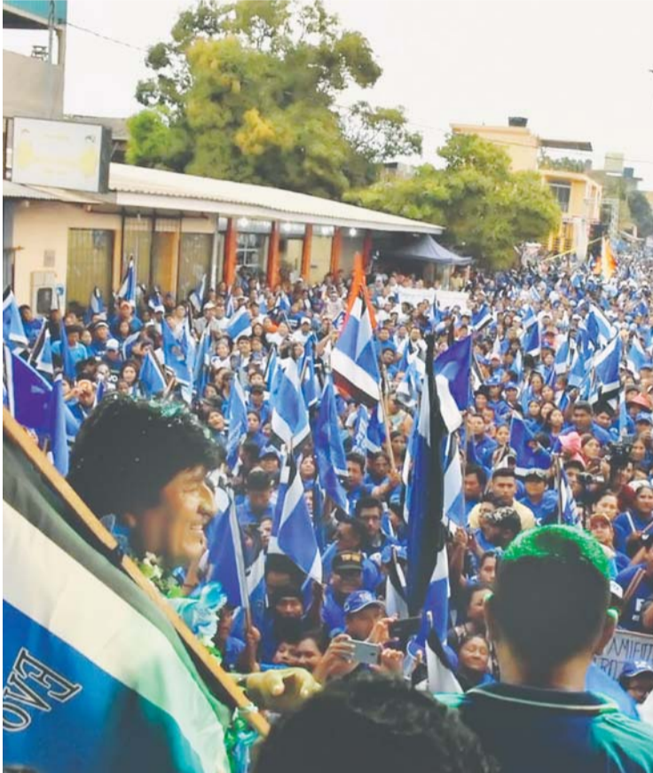
EVO MORALES EN EL CIERRE DE CAMPAÑA DEL MAS EN PANDO. FUE AYER.