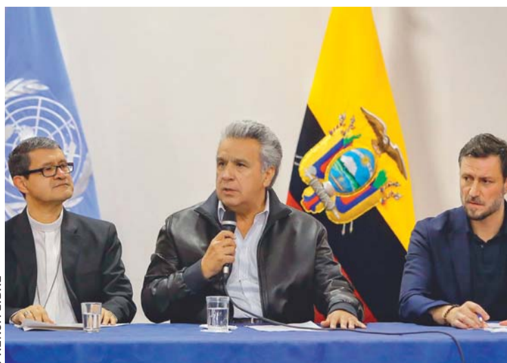
LENÍN MORENO EN EL MOMENTO QUE DEROGABA EL DECRETO.

Los once días de protestas no han dejado ni mucho menos vencedores en el campo de batalla política, y de hecho parece que solo hay perdedores.