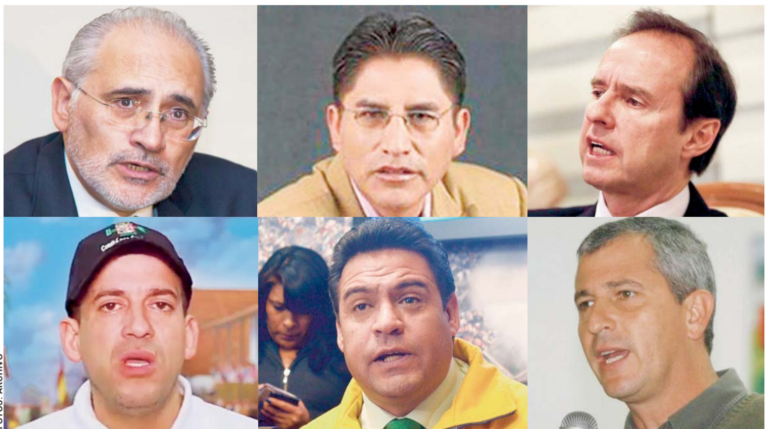
CADA VEZ SE SUMAN MÁS ROSTROS EN EL MURAL DE ASPIRANTES A LA PRESIDENCIA DE BOLIVIA.