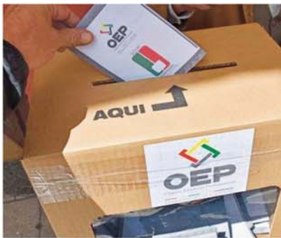
EN EL TSE SE SIENTA PRINCIPIO DE AUTORIDAD PARA GARANTIZAR ELECCIONES TRANSPARENTES; DESPUÉS DEL FRAUDE DESCUBIERTO EN 2019.

Se establecen sanciones pecuniarias que alcanzan hasta el 60% del salario mínimo nacional, para los jurados y notarios electorales que incurran en contravenciones durante el proceso electoral.