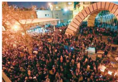
PROTESTA AFUERA DE LA UNIVERSIDAD AMIR KABIR.

Entre los mencionados favoritos están: "Joker", "El Irlandés", "1917", "Erase una vez en Hollywood", "Historia de un matrimonio"; entre otras muchas películas que aspiran a hacerse con el mayor número de nominaciones para lograr convertirse en los protagonistas de la esperada gala.