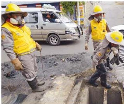
ATENCIÓN DE EMERGENCIA PARA PERMITIR EN PASO DE AGUA DESPUÉS DE LA INTENSA LLUVIA.

ras de desagüe y alcantarillas. Según reporte de emergencia municipal, se atendió dos inundaciones y la caída de un muro, en viviendas particulares. Estos incidentes se registraron en la calle 35 de Cota Cota (caída de un muro), Max Paredes y en el Casco Urbano Central (inundaciones).