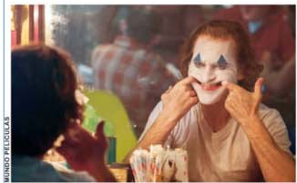
UNA DE LAS ESCENAS MÁS IMPRESIONANTE DE LA PELÍCULA "JOKER" (GUASÓN), QUE EN BOLIVIA TUVO MARCADO ÉXITO.

Irán admitió este sábado que derribó "intencionalmente" el avión de Ukraine International Airlines, tres días después del incidente que mató a los 176 que viajaban en la aeronave Boeing 737-800. (BBC NEWS)