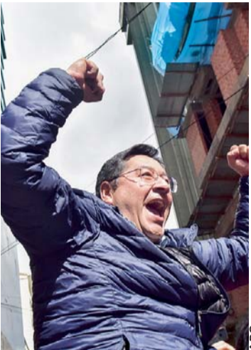
LUIS ARCE FESTEJA LA SUSPENSIÓN DE SU AUDIENCIA.