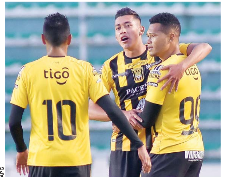
FESTEJO DE LOS ATIGRADOS. FUE ANOCHE EN EL ESTADIO HERNANDO SILES.

grada" en el torneo Apertura. El resultado y el rendimiento se muestran muy ajustados con relación al rival; por cuanto los paceños deberán mejorar su esquema para los próximos compromisos.