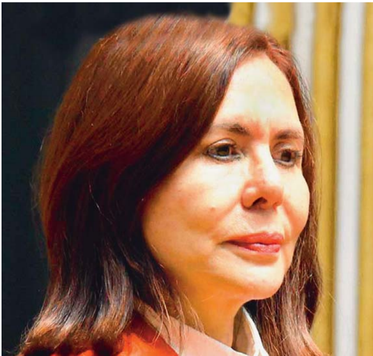
CANCILLER DE BOLIVIA, KAREN LONGARIC RODRÍGUEZ.