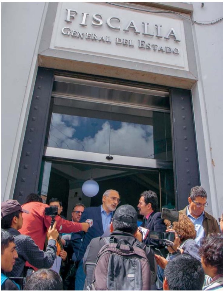
CARLOS MESA JUNTO A INTEGRANTES DE LA ALIANZA COMUNIDAD CIUDADANA, LUEGO DE ENTREGAR LA DENUNCIA ANTE LA FISCALÍA GENERAL DEL ESTADO. FUE AYER EN SUCRE.

También solicitó que en el proceso se gestione que los responsables del dolo reparen al Estado el gasto económico de las elecciones de 2019, cuya suma asciende a Bs 217 millones, provenientes del Tesoro General del Estado y que fueron “echados a la basura, por el fraude electoral”, dijo.