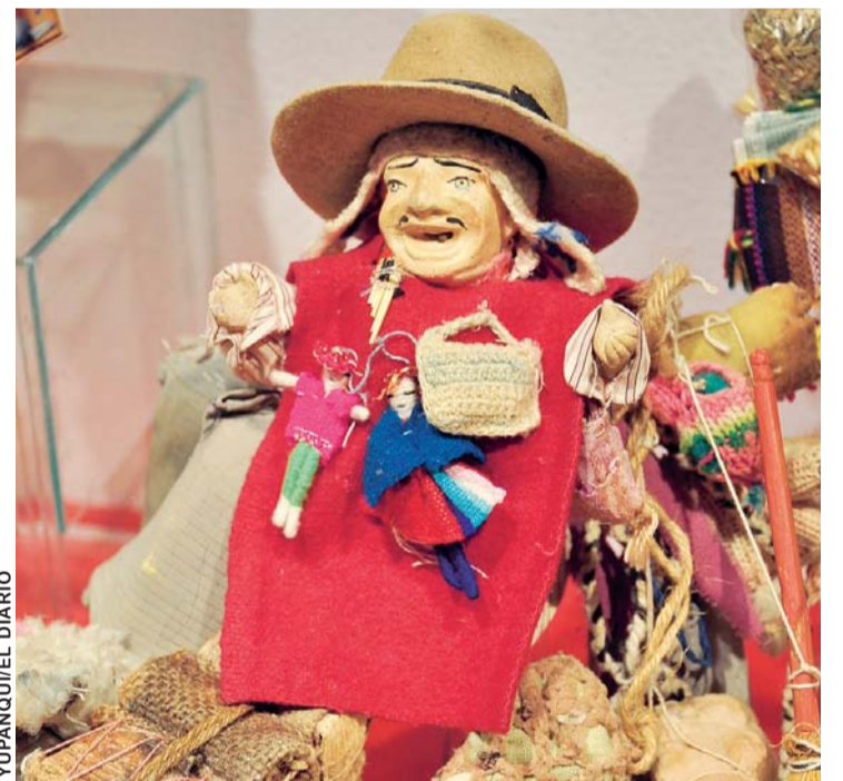
EL EKEKO RUBIO ES EL NUEVO TESORO DEL MUSEO COSTUMBRISTA.

Es el nuevo tesoro del repositorio municipal, un Ekeko que satiriza a los antiguos patrones europeos. A pesar de su tamaño, su pelo dorado y ojos celestes es lo primero que impresiona cuando se lo ve. Su tez blanca también lo diferencia del resto de diosillos que reposan en el museo ubicado al frente de la plaza Rio-sinio. (AMN)