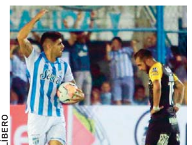
EL TIGRE FUE DERROTADO EN ARGENTINA.