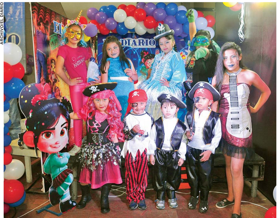
IMAGEN PERTENECE A LA EXITOSA TOMA DE FOTOGRAFÍAS DE 2019.