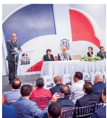
AUTORIDADES ANUNCIANDO LA DETERMINACIÓN.

Poco más de 7,4 millones de electores estaban convocados a votar este domingo para elegir a los 3.849 cargos en los 158 municipios de todo el país.