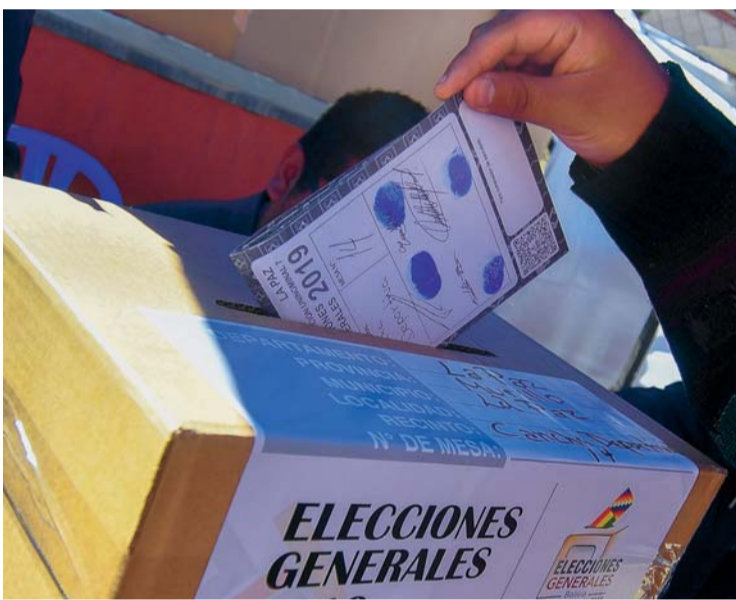
COMICIOS EN BOLIVIA.

El Tribunal Supremo Electoral (TSE) publicó ayer los mapas