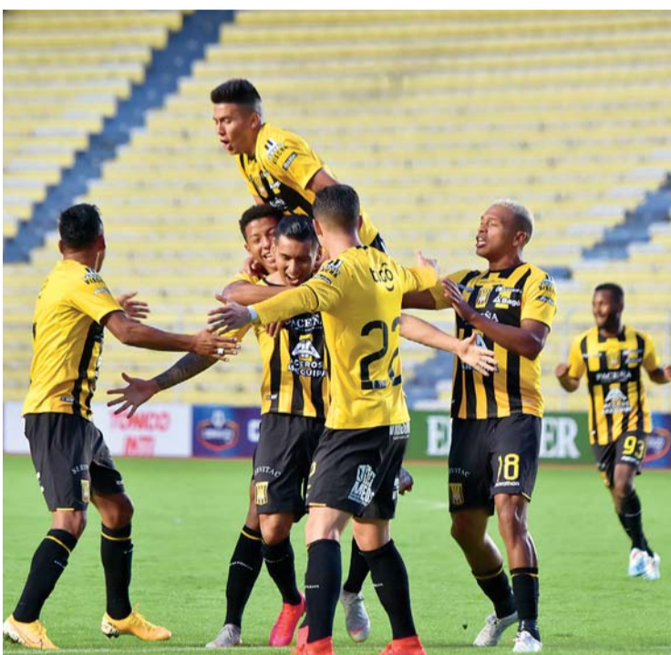
FESTEJO "ATIGRADO" DESPUÉS DEL ÚNICO TANTO DEL PARTIDO.

Con la ajustada victoria, los "atigrados" salieron del fondo de la tabla de posiciones con seis puntos y el representante de Quillacollo quedó con 10 unidades.