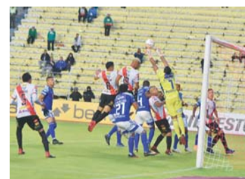
VALERO EL DIARIO

INCIDENCIAS DEL COTEJO DISPUTADO ANOCHES EN LA PAZ.