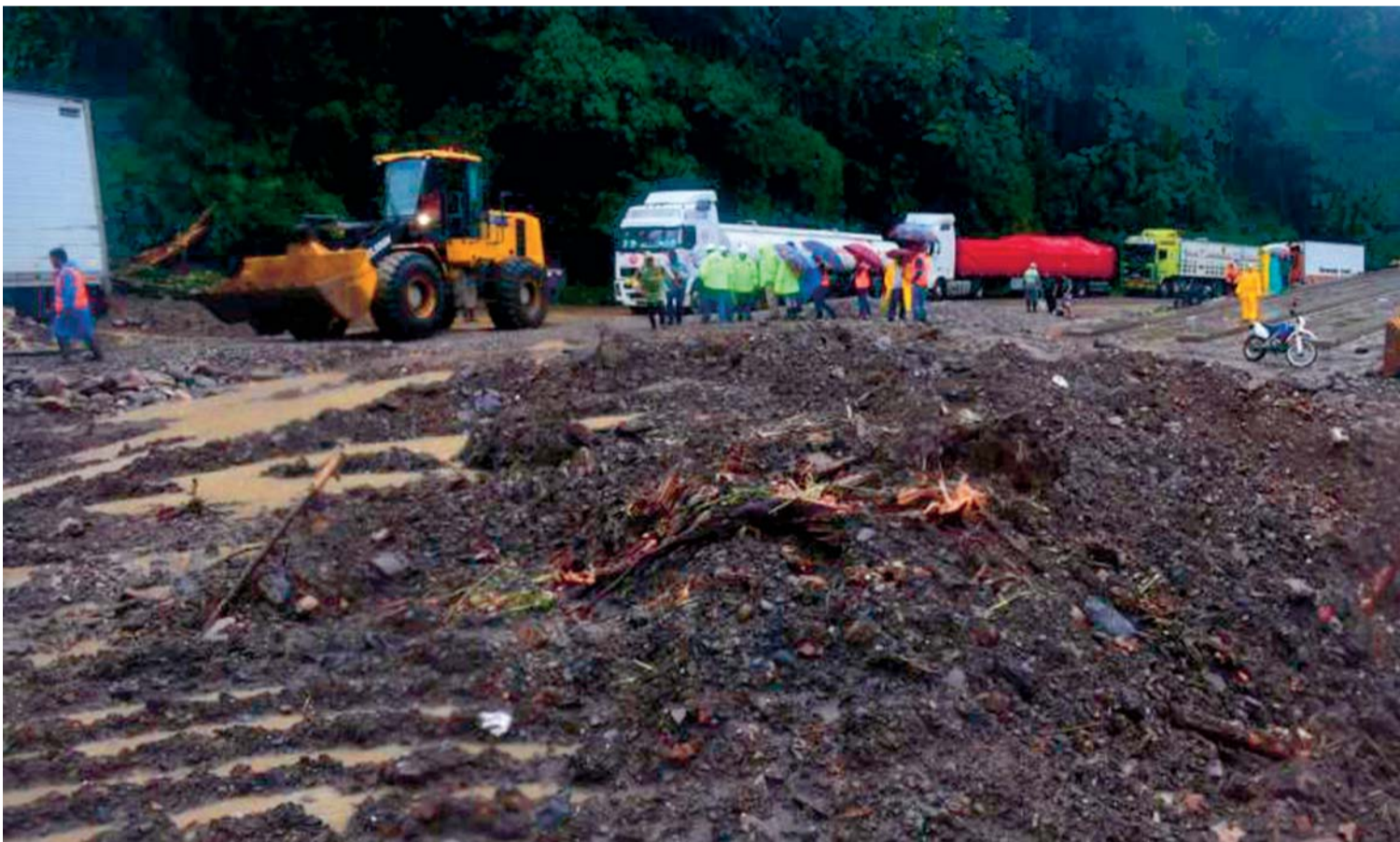
LOS TIEMPOS DIGITAL

DERRUMBE EN EL SILLAR, CAMINO NUEVO ENTRE COCHABAMBA Y SANTA CRUZ. FUE AYER.