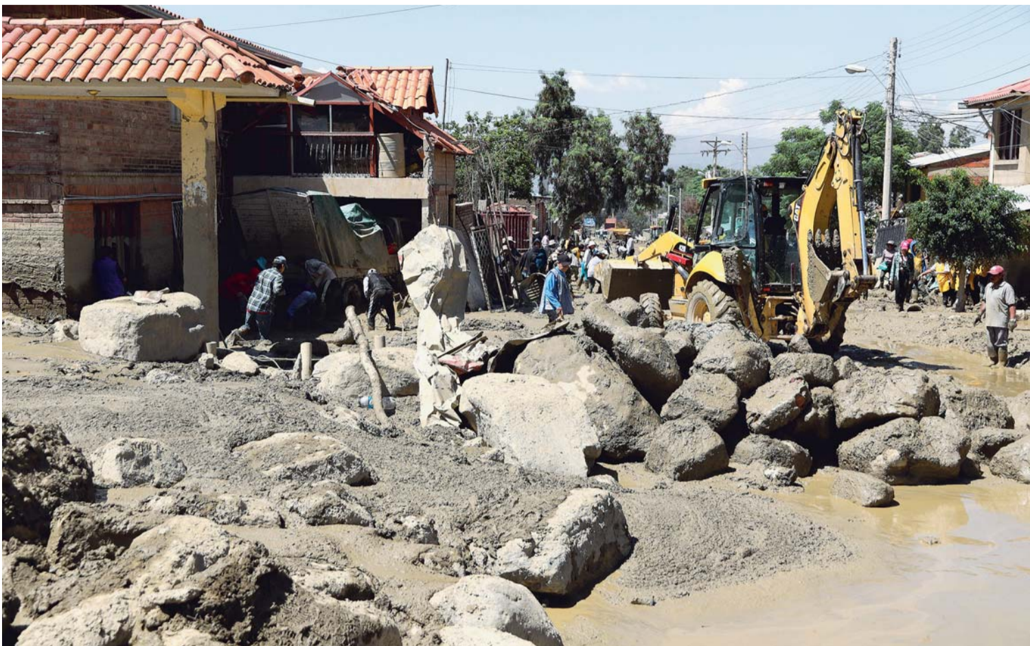
EN EL MUNICIPIO DE TIQUIPAYA EXISTEN UNAS 560 PERSONAS AFECTADAS, ENTRE NIÑOS, ADULTOS Y ADULTOS MAYORES, QUE FUERON TRASLADADOS A ALBERGUES, DONDE TIENEN UN ESPACIO PARA DORMIR, RECIBEN ALIMENTACIÓN Y CUENTAN CON ATENCIÓN MÉDICA.