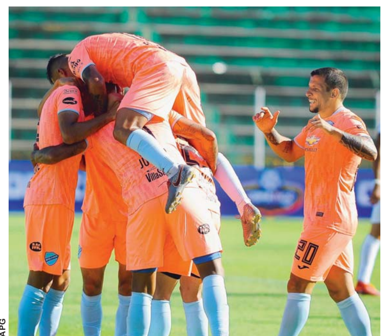
FESTEJO DE BOLÍVAR, AYER EN SANTA CRUZ.

Explicó que la exdirigente fue interceptada en vía pública donde fue notificada, inmediatamente aprehendida y conducida a la Felcc. (ABI)