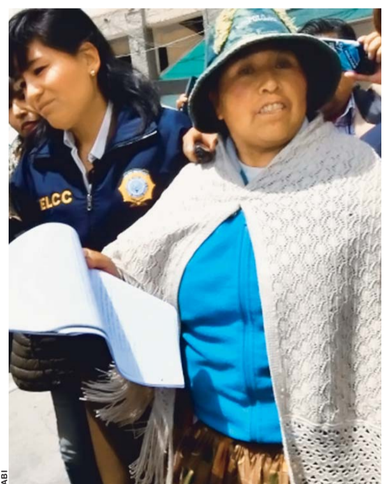
ES SINDICADA DE HABER RECIBIDO BS 99.528 PARA LA EJECUCIÓN DEL PROYECTO AYNÍ, DE FORTALECIMIENTO ORGÁNICO.