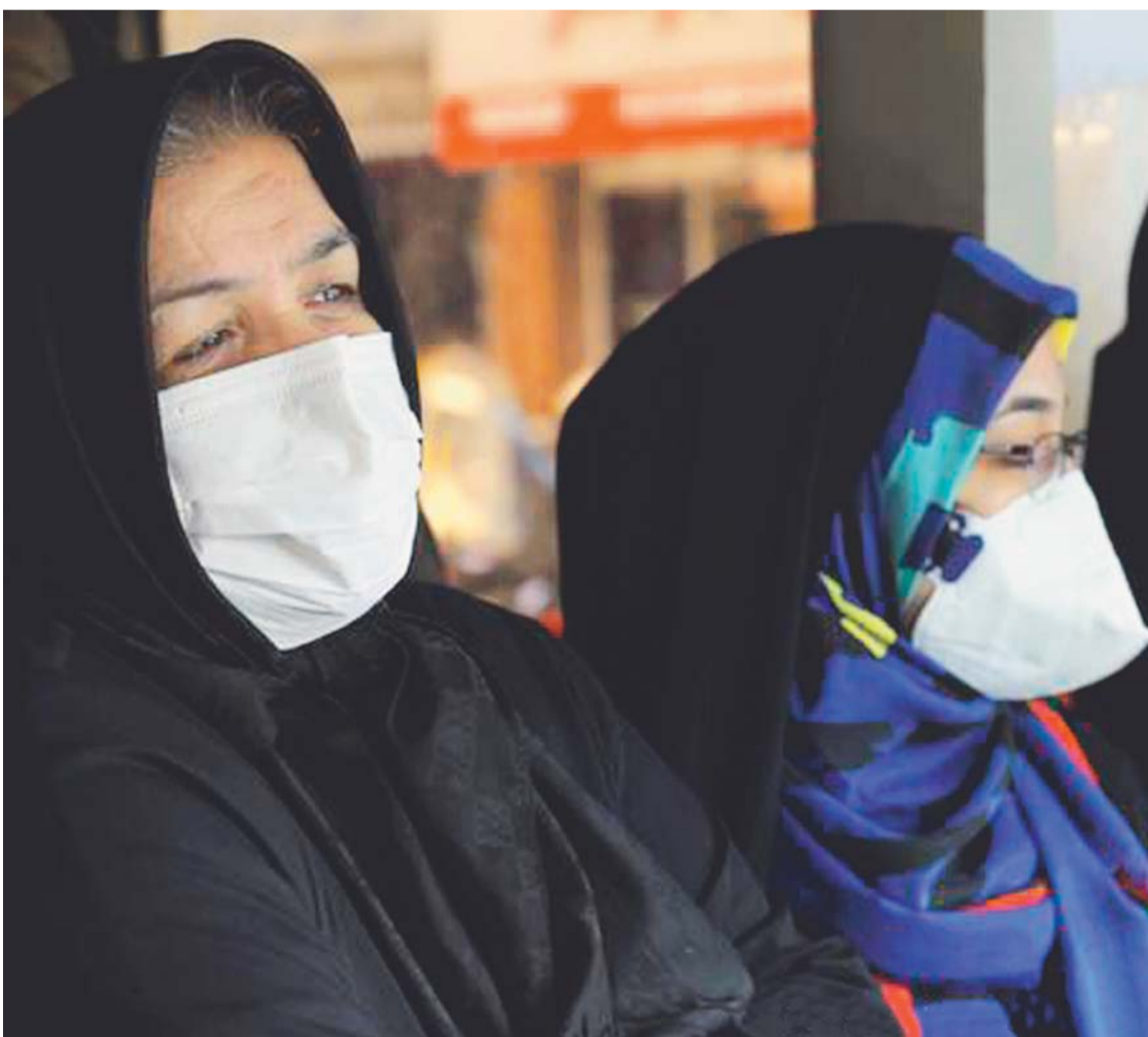
EL CORONAVIRUS GOLPEA IRÁN.