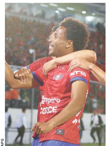
FESTEJO DE LOS "AVIADORES"

En cambio, Bolívar fue derrotado por el mismo resultado durante su visita a Guaraní en Paraguay; mostrando un fútbol poco ofensivo y una defensa deficiente.