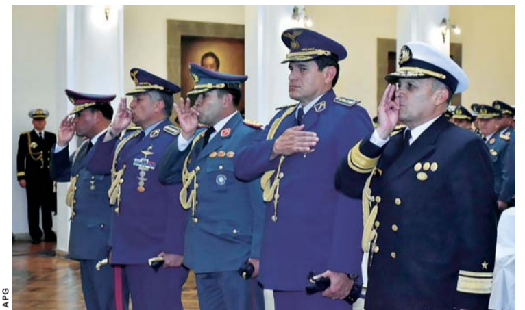
NUEVAS AUTORIDADES MILITARES EN EL MOMENTO DE SU POSICIÓN.