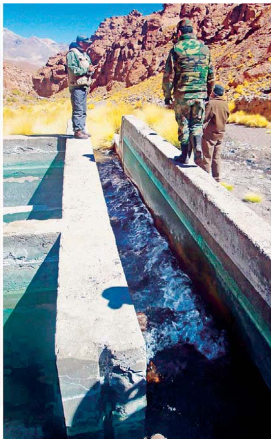
EL DIARIO, EL PRINCIPAL PERIÓDICO DE BOLIVIA, EN VARIAS DE SUS EDICIONES, PUBLICÓ QUE LAS AGUAS DEL SILALA TIENEN ORIGEN EN TERRITORIO BOLIVIANO Y QUE FUERON DESVIADAS DE MANERA ARTIFICIAL HACIA CHILE Y SIN COSTO ALGUNO.