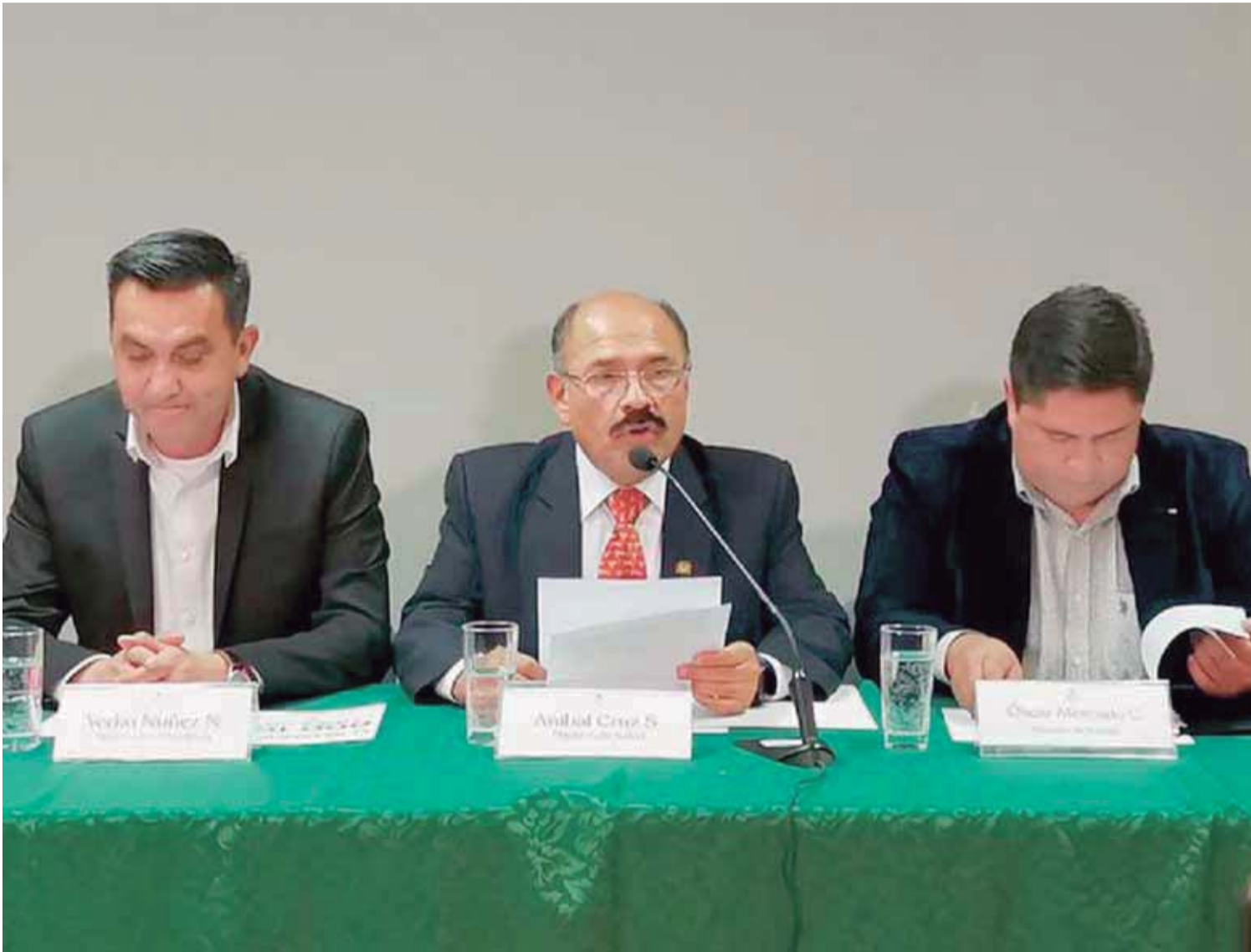
AUTORIDADES ANUNCIAN OFICIALMENTE QUE EL NÚMERO DE INFECTADOS CON CORONAVIRUS EN BOLIVIA SUBIÓ DE 3 A 10. FUE AYER.