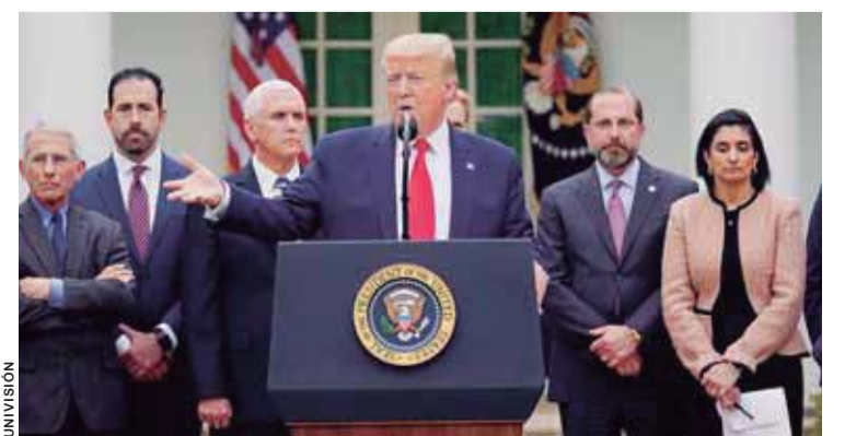
DONALD TRUMP DURANTE LA CONFERENCIA DE PRENSA.

La medida permitirá desbloquear hasta 50.000 millones de dólares en fondos federales para ayudar a los estados y localidades de EEUU a combatir la enfermedad.