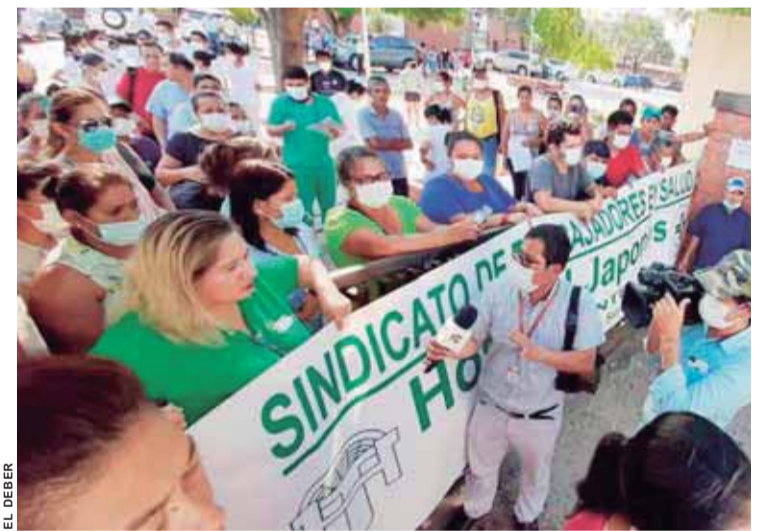
PROTESTA DE UN SINDICATO DE TRABAJADORES EN SALUD DE SANTA CRUZ, FUE CUANDO TRATABAN DE INTERNAR A UNA PACIENTE CON CORONAVIRUS EN UN HOSPITAL DE LA CAPITAL.

"Ante los que intentan impedir el trabajo del Gobierno para atender la lucha contra el coronavirus, el Ministerio de Gobierno (...) avisa que activará todo el peso de la ley. No permitiremos que se sabotee el trabajo y la atención a los pacientes afectados (...) y no permitiremos que se ponga en riesgo la salud de los bolivianos", cita el documento. (ABI)