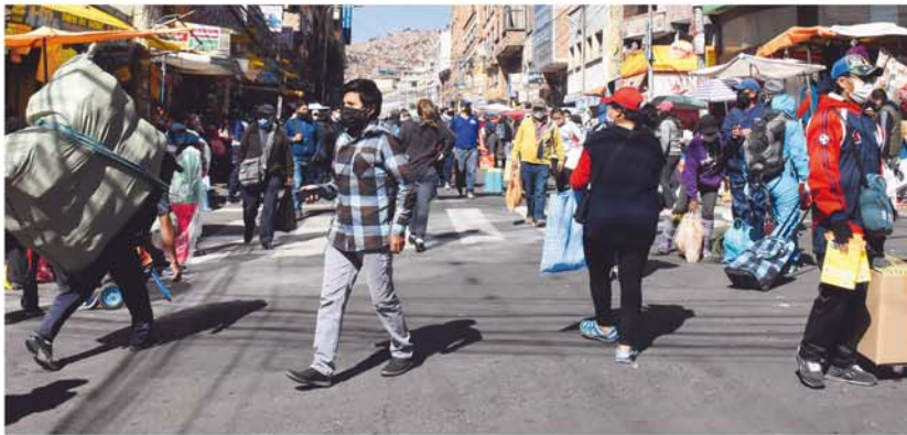
LA CUARENTENA INGRESARÁ A LA ETAPA DINÁMICA CON RANGO DE HORARIO EN EL PAÍS. EN VARIAS REGIONES ANTECEDE EL DESORDEN.

> Mediante un decreto se activa la cuarentena dinámica, pero permite que departamentos y municipios se autorregulen. La circulación de personas será de 5.00 a 18.00 horas sin restricciones de salida por número de carnet