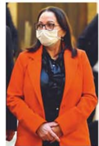
MINISTRA DE SALUD, EIDY ROCA.

> La Jefa de Estado pidió a Roca asumir el enorme desafío y tomar el mando de la cartera de salud, las políticas públicas, reestructurarlas y transparentarlas. Le encargó la misión de comprometerse con la salud de las familias bolivianas