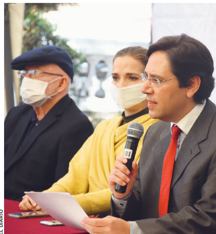
EL PRESIDENTE DEL TSE, SALVADOR ROMERO, PRESENTÓ EL PROYECTO DE LEY PARA LAS ELECCIONES GENERALES.

este es el resultado de una ardua labor de negociaciones y consultas entre el Órgano Electoral y todos los representantes de partidos políticos, emprendido semanas atrás. Por otro lado, esta decisión también se debe a la presión social ante las pretensiones y el show político armado por el Movimiento al Socialismo, según actores políticos. Además, se anunció que el calendario electoral se reanudará la segunda quincena de julio.