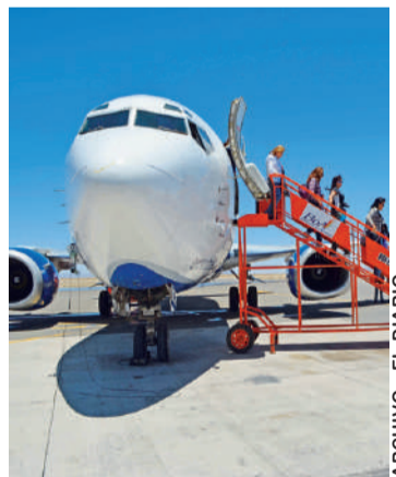
TRES AEROPUERTOS CONTINUARÁN CERRADOS EN EL PAÍS.

El pasado viernes, el ministro Arias informó que los servicios aéreos en las rutas interdepartamentales serían retomados el miércoles 3 de junio, bajo estrictas medidas de bioseguridad para evitar contagios de coronavirus.