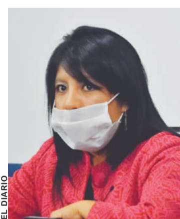
NADIA CRUZ, DEFENSORA DEL PUEBLO.

En enero del año pasado, la Asamblea Legislativa Plurinacional (ALP) eligió a Nadia Alejandra Cruz Tarifa como la Defensora del Pueblo en calidad de interina tras la renuncia de David Tezanos, este último se vio envuelto en críticas por exponer su vida privada en rueda de prensa en instalaciones de la Defensoría del Pueblo.