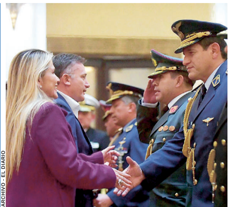
PRESIDENTA JEANINE AÑEZ, JUNTO AL ALTO MANDO DE LA FUERZAS ARMADAS.

Asimismo, recordó que ya están en ejecución los planes "trabajo" y "salario" destinados a proteger a las empresas y que estas a su vez, protejan a sus trabajadores. De la misma manera, las ayudas a las familias mediante los bonos y los diferimientos en los pagos de servicios y créditos.