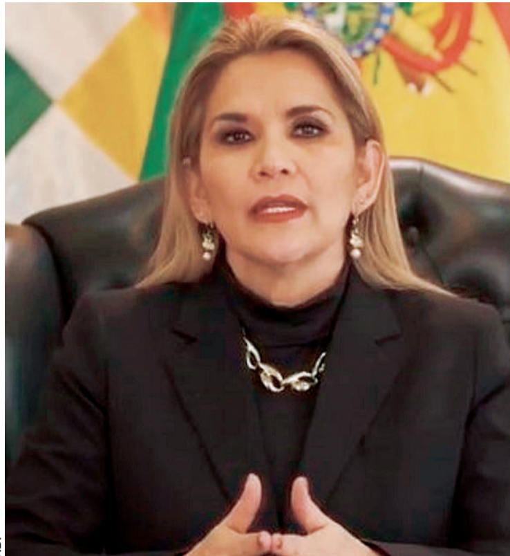
PRESIDENTA JEANINE AÑEZ, EN MENSAJE A LA NACIÓN.

> Mediante una instrucción directa de la mandataria al gabinete ministerial, también se ordenó realizar una investigación profunda y a detalle para identificar a los cargos innecesarios y "gastos absurdos" creados por el Movimiento al Socialismo